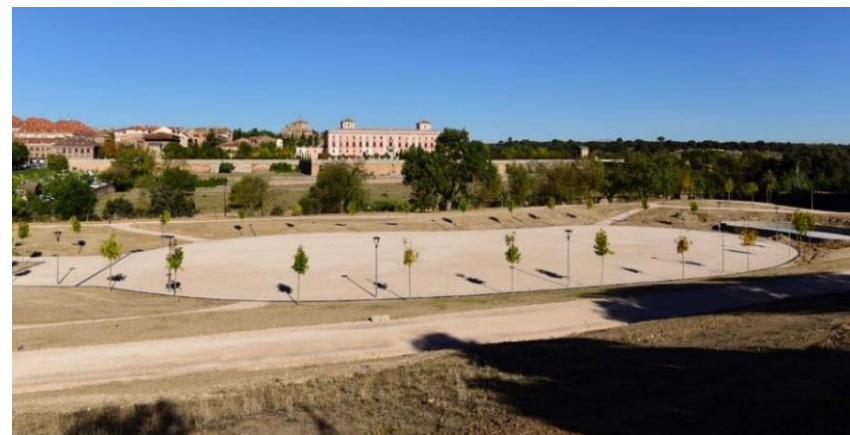
Vista general del parque del Nacedero