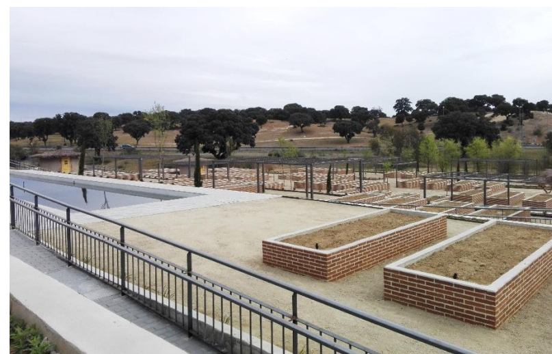
Plano Huertos urbanos y panorámica general