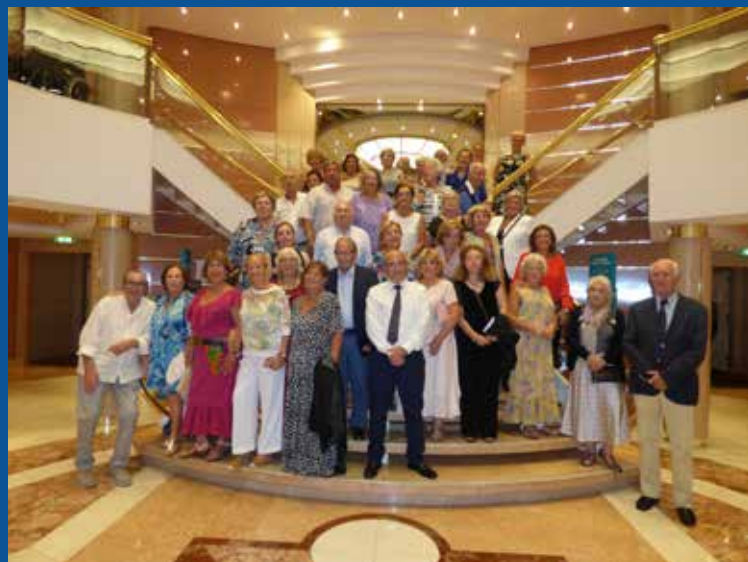
“Participantes en el viaje en crucero por el Mediterráneo y Adriático organizado por la Asociación Mayores de Boadilla”.