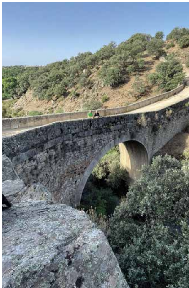
Foto: Puente de la Marmota. Colmenar Viejo