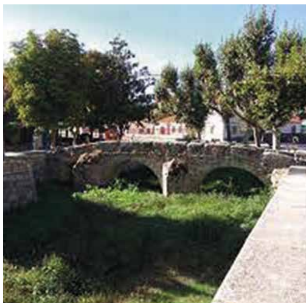
Foto: Puente Colmenar del Arroyo