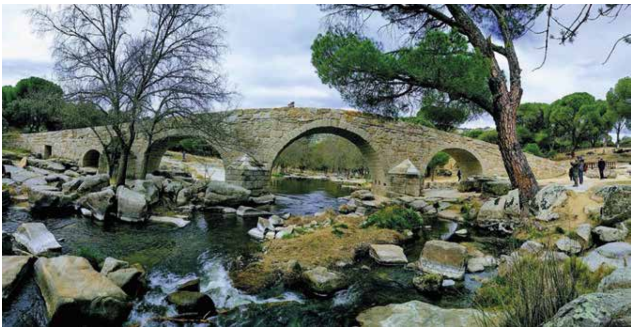
Foto: Puente Mocha sobre el río Cofio

De hechuras elegantes, con muchos más ojos de los que el limpio caudal del río podría agobiar en los mejores momentos del deshielo.