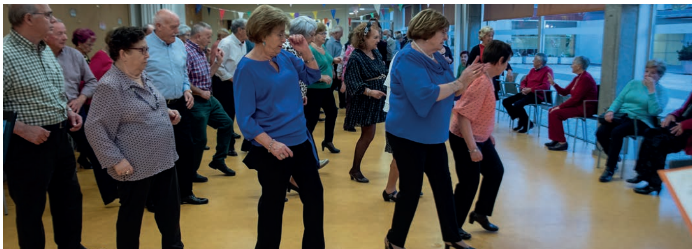
Baile de mayores

el Baile de Mayores será los días 6, 13 y 27 de abril, 11 de mayo, y 1, 8 y 15 de junio.