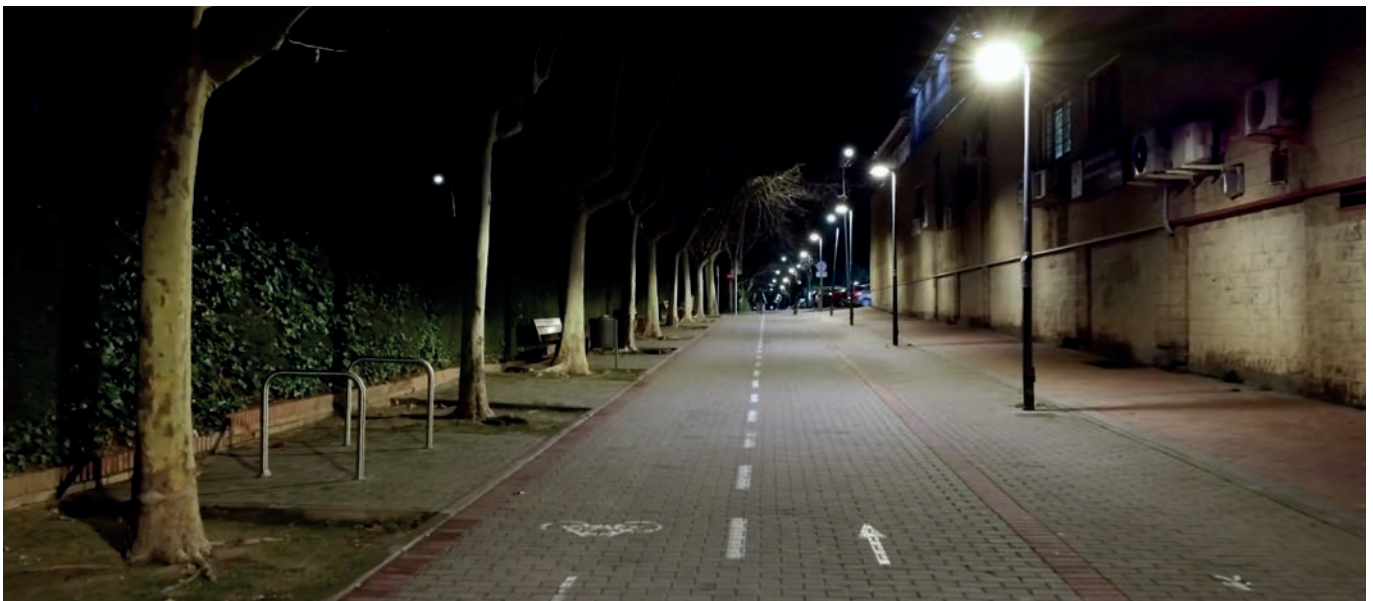
Iluminación en Las Eras