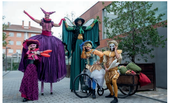
Entierro de la sardina