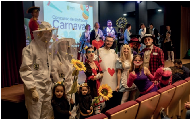
Concurso de disfraces