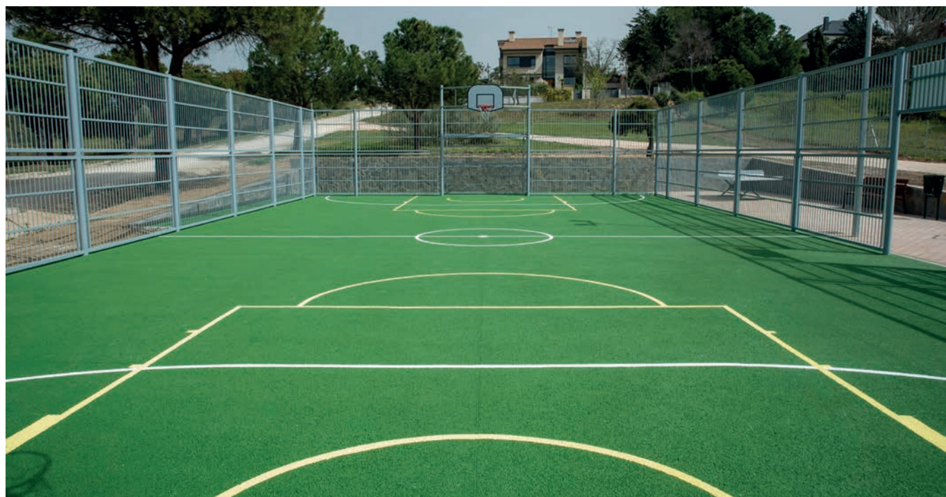
Nueva zona deportiva en Bonanza

habilitará una zona estancial pavimentada con adoquín multicolor en la que se van a colocar una fuente de agua potable. Ya se han instalado bancos y papeleras, una mesa de ping-pong y dos mesas de juegos . Los caminos colindantes tienen suelos de zahorra. La instalación cuenta con alumbrado público. La obra ha tenido un presupuesto de 79.430 euros .