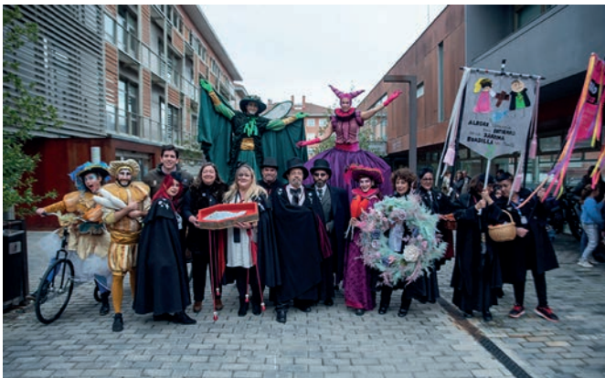
Entierro de la sardina