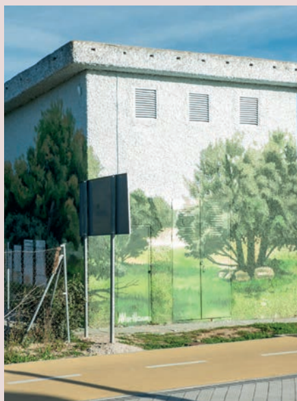
► Calle Playa del Saler con Playa del Perelló (Valdecabañas)