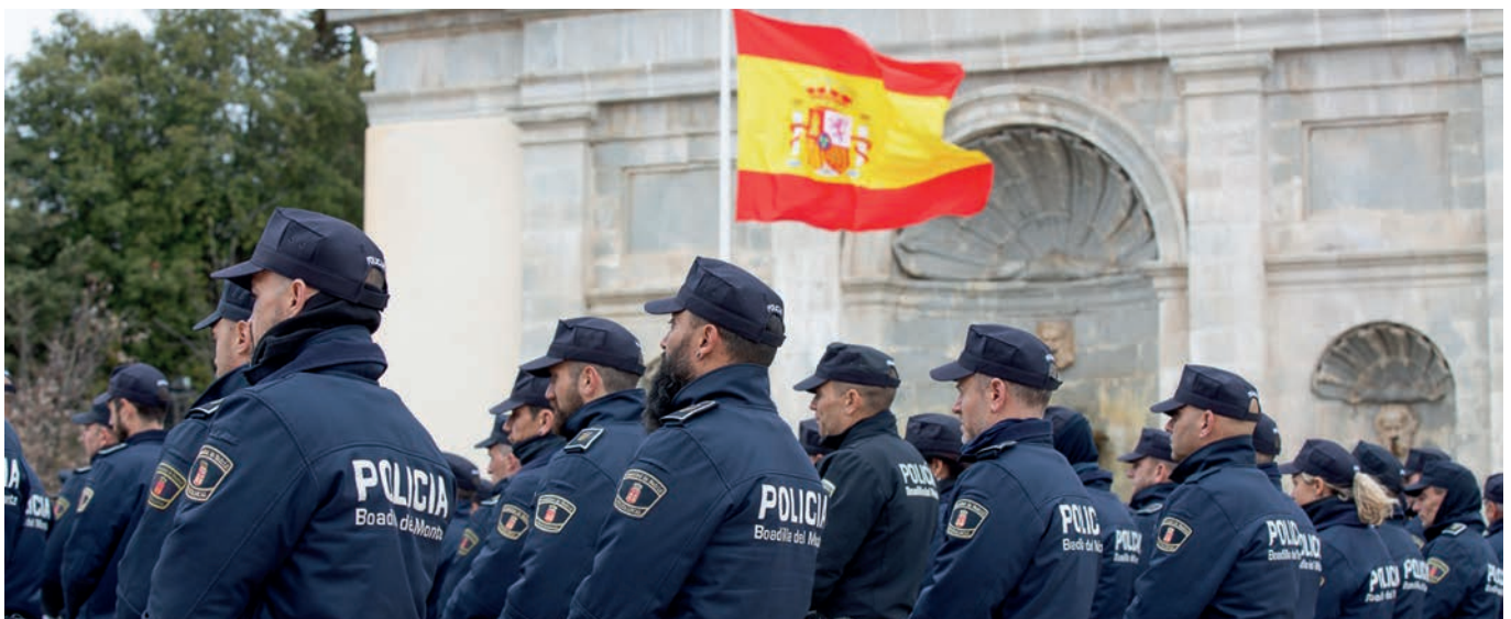
Agentes de la Policía Local