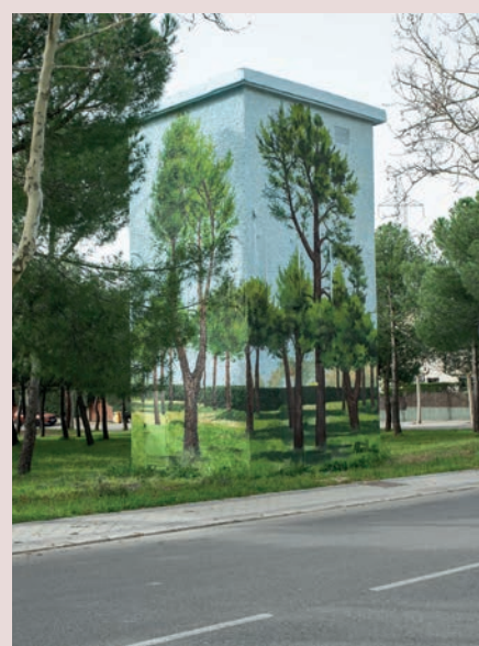
► Calle de Formentor (Valdecabañas)