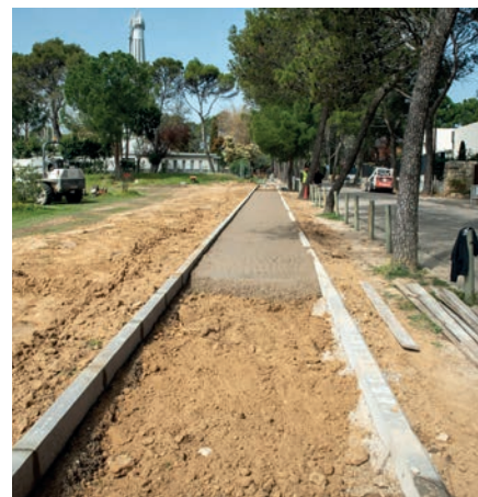
Acerado en el Valle del Roncal

La inversión total para estas actuaciones será de 1.493.632,16 euros . Las obras están cofinanciadas con Fondos del Plan de Inversión de la Comunidad de Madrid .