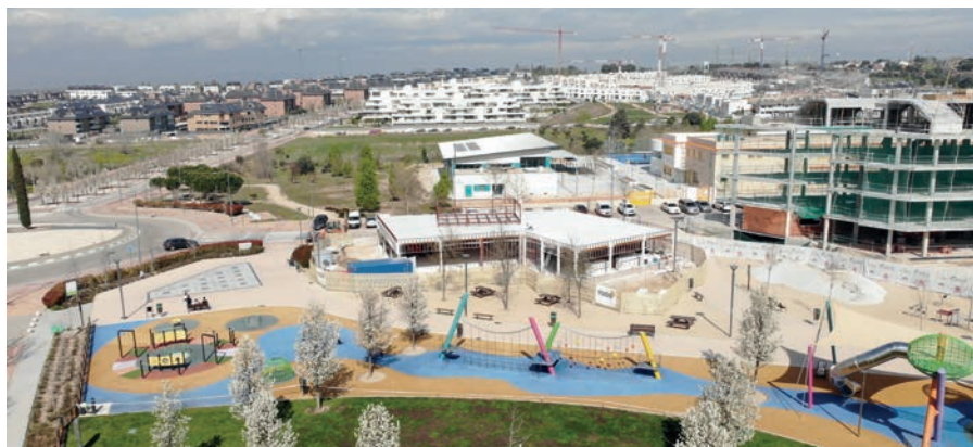
Quiosco en el parque Miguel Ángel blanco

Las obras de construcción de esta infraestructura ya han comenzado y el local estará presumiblemente operativo el próximo verano. Ubicado en la zona noroeste del parque - próxima a la calle Cristóbal Colón y glorieta de las Fuerzas Armadas- el edificio, de una sola planta, se