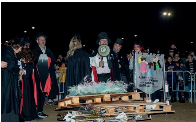
Entierro de la sardina