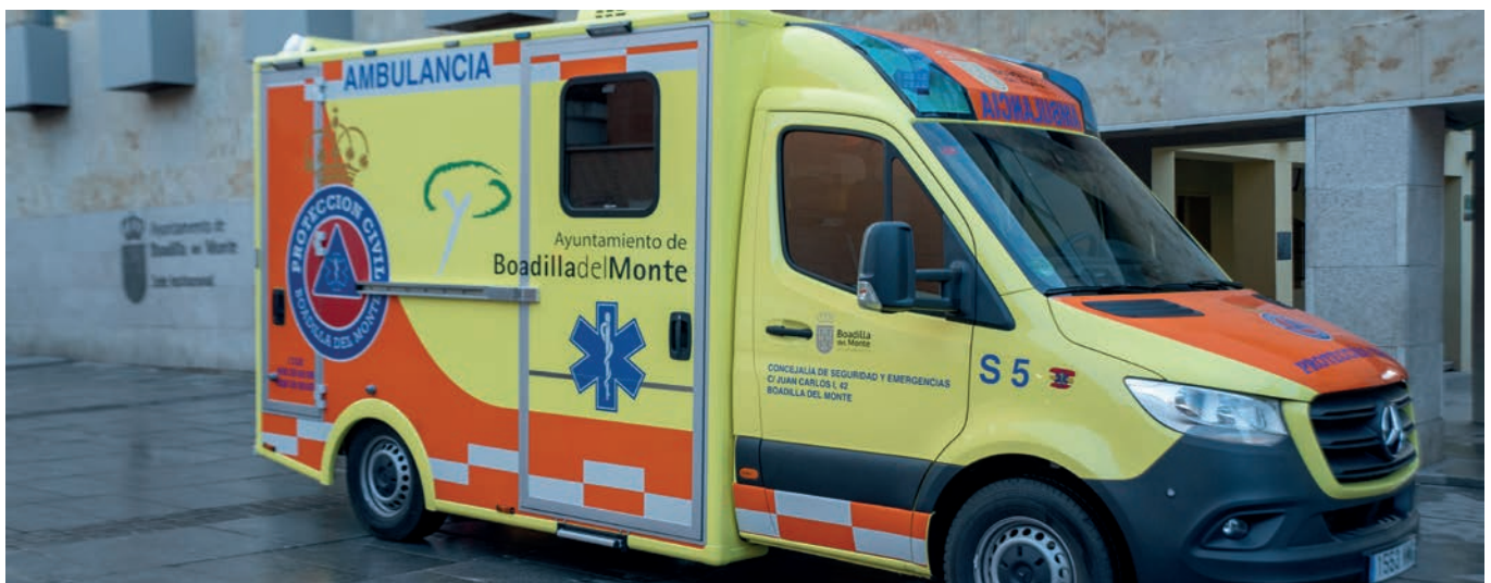
Nueva ambulancia de soporte vital

La ambulancia, que está operativa de forma ininterrumpida, ha sido adquirida mediante concurso público, con un coste de 126.000 euros más IVA ; sustituirá a la actual que, por su antigüedad y según marca la normativa, no podrá seguir ejerciendo su función.