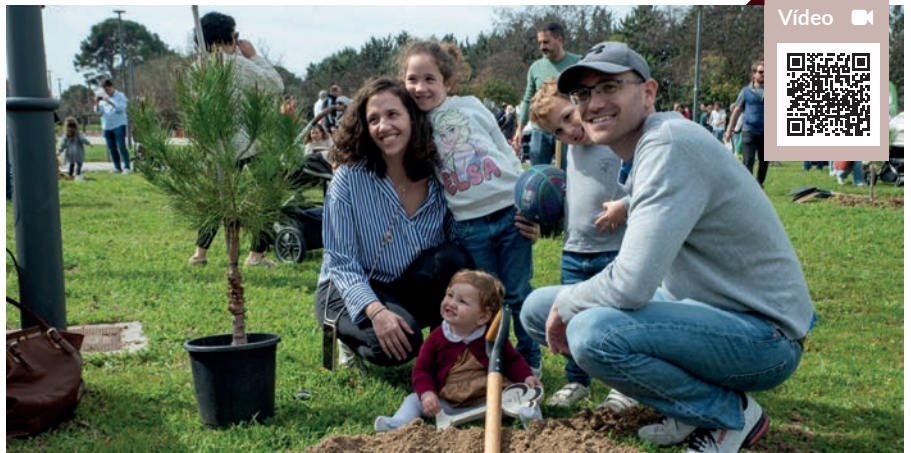
Plantación de árboles en Olivar de Mirabal

En cada árbol plantado se ha colocado una placa de madera con el nombre y la fecha de nacimiento del bebé.