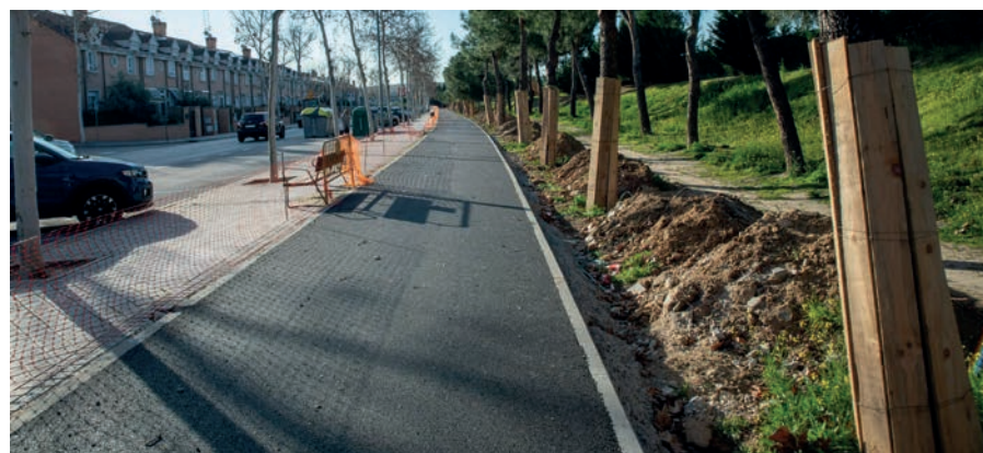
Ampliación del carril bici

La obra, cuyo importe de adjudicación fue de 1.064.316 euros , está cofinanciada con Fondos NextGenEU de la Unión Europea .