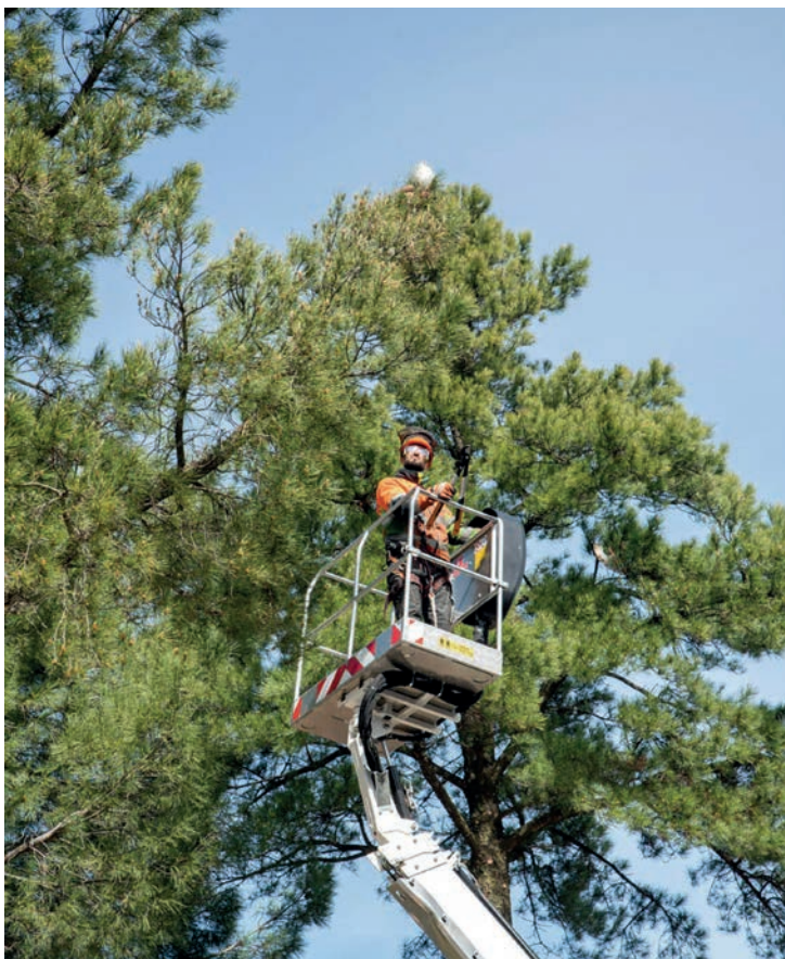
Retirada de nidos de oruga

Su presencia en zonas concurridas se puede notificar en el correo servicios@aytoboadilla.com