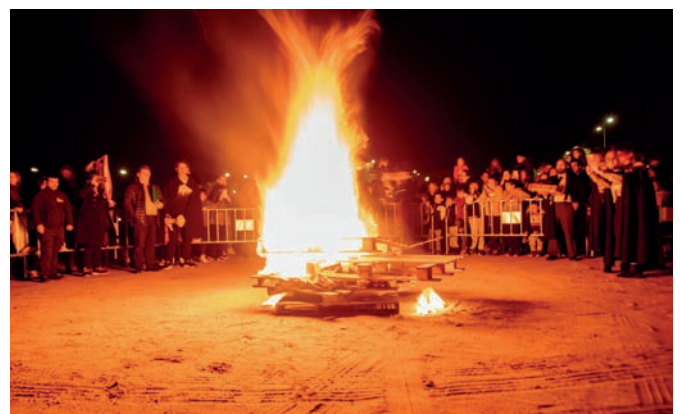
Hoguera de Carnaval