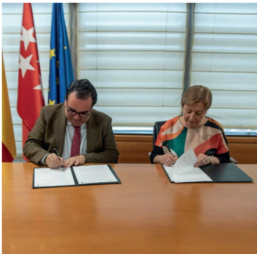
El alcalde y la presidenta de la Asociación de Mayores firman el convenio

El Ayuntamiento ha renovado el convenio anual con la Asociación de Mayores del municipio por el que esta recibe una subvención de 150.000 euros para la financiación de actividades como actos sociales, viajes, excursiones culturales y de naturaleza y actividades formativas y culturales, entre otras.