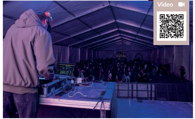
Carpa joven Carnaval