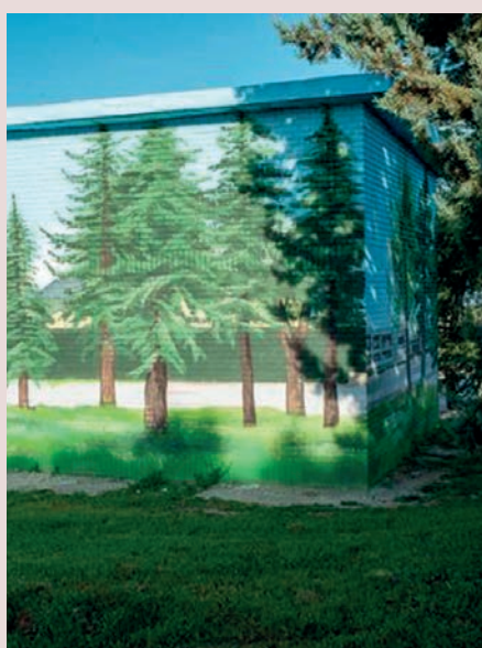
► Avenida de Guadarrama con calle Río Tajo (Parque Boadilla)