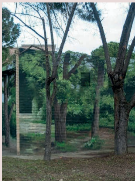
► Avenida de las Lomas con avenida de Valdepastores