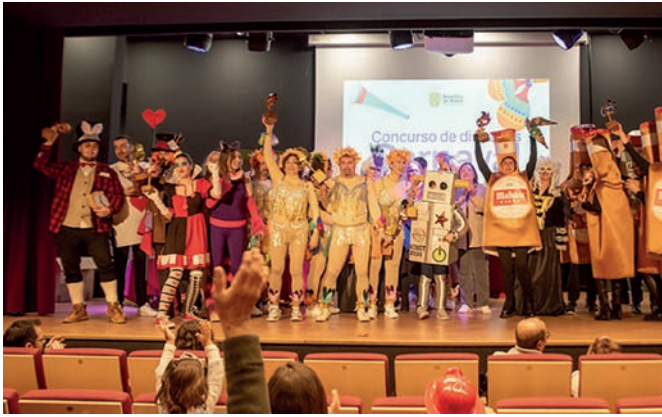
Concurso de disfraces