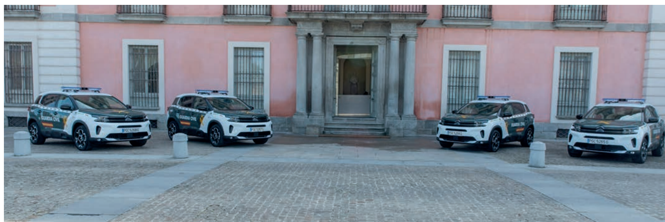
Vehículos cedidos la Guardia Civil

• 32.200 seguidores en Facebook; 1.700 en X y 5400 en Instagram, con más de 5.750.000 visualizaciones en la marca “@PoliciaDeBoadilla”.