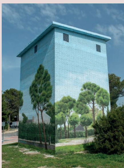
► Calle Valle del Moro con calle Río Zújar (Parque Boadilla)