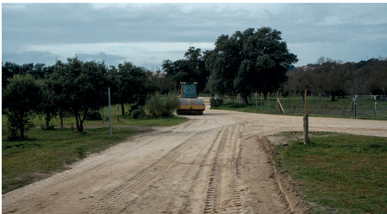
Mejoras en los caminos del monte

se ha refinado y aplanado la superficie y se han repasado o abierto nuevas cuentas para lograr el drenaje longitudinal de las aguas. Finalmente, se ha compactado el terreno para dar estabilidad y resistencia mecánica a la explanación.