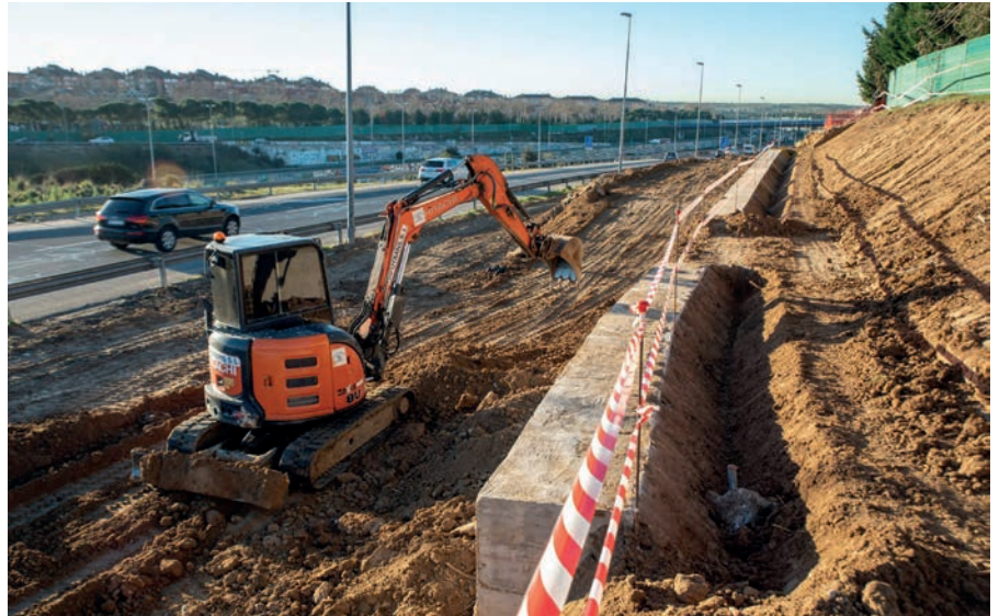
Obras de incorporación a la M-50

Los trabajos consisten en modificar el acceso a la M-513 desde la estación de servicio, generar un tercer carril en esta vía y ampliar a dos carriles el ramal de acceso a la misma desde la avda. Infante D. Luis , uno de los cuales hará de bypass para facilitar esa incorporación directa a la M-50.