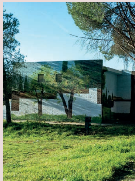
► Calle Vallefranco (Las Lomas)