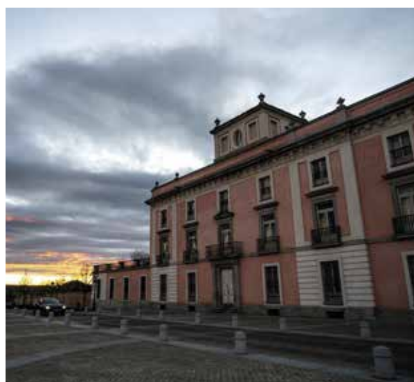
Fachada del Palacio del Infante D. Luis

El acceso al tramo de la avenida Adolfo Suárez que discurre por la explanada del Palacio está controlado por una cámara de seguridad que detecta a los vehículos que pasan en ambas direcciones.