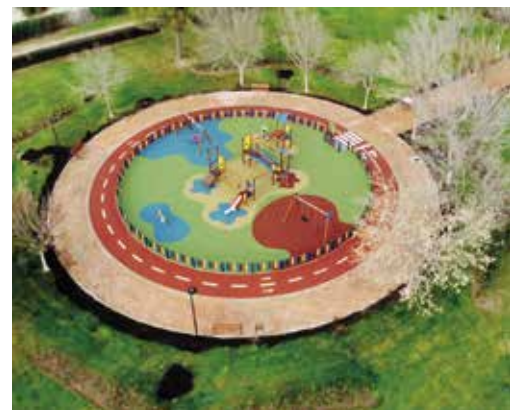
Vista aérea del parque Azorín

tentes; la pavimentación con adoquín del perímetro de la zona de juegos y de la entrada al parque; la renovación del mobiliario urbano (bancos y papeleras); la instalación de una nueva valla electrosolada para el área canina; y el cambio del alumbrado por otro de tecnología LED. La remodelación ha contado con una inversión de 79.509,62 euros.