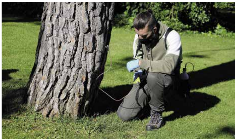
Tratamiento de endoterapia en los árboles

Como cada año, el Ayuntamiento ha desarrollado la campaña de tratamientos fitosanitarios sostenibles contra la oruga procesionaria del pino, mediante la aplicación de endoterapia, método que consiste en inyectar el producto directamente en el sistema vascular del árbol. El impacto ambiental de esta técnica es mínimo y no presenta riesgos para personas y animales , ya que el producto es inyectado usando la tecnología ENDOplant, que imposibilita la salida al exterior una vez introducido. El tratamiento es efectivo durante los dos años siguientes a la fecha de aplicación. En total se han tratado con esta técnica 800 ejemplares. El Ayuntamiento cuenta con personal