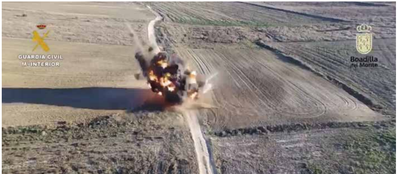
Explotación controlada del artefacto hallado en Boadilla

El artefacto fue descubierto por unos operarios que trabajaban en el talud de una parcela y fue trasladado a una zona de seguridad, donde se explotó de forma controlada