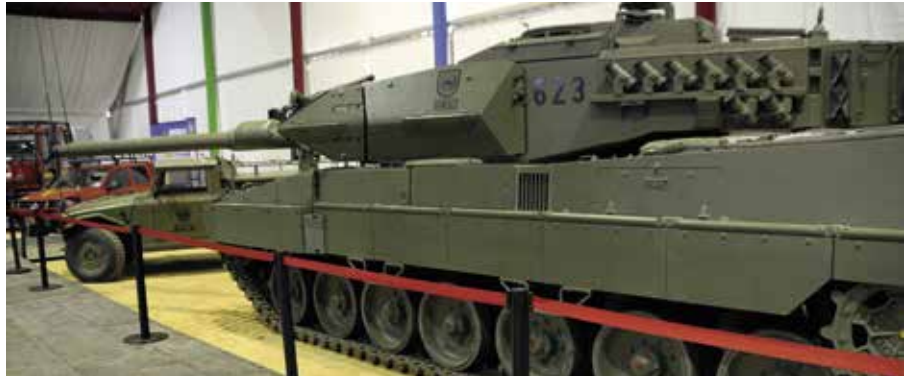
Material militar exhibido en EXPO HÉROES

Más de 4000 personas visitaron Expo Héroes, la muestra organizada por el Ayuntamiento en la que las Fuerzas Armadas y los Cuerpos de Seguridad y Emergencias exhibieron parte del material y los equipos humanos con los que trabajan y explicaron a los asistentes en qué consiste su tarea diaria. En concreto participaron en la exposición la Unidad Militar de Emergencias (UME) , el Ejército de Tierra , el Ejército del Aire , la Armada , Guardia Civil , Policía Nacional , Policía Local y Protección Civil de Boadilla , que llenaron con su equipamiento y personal 1200 metros cuadrados de superficie en la carpa del Recinto Ferial. Niños y mayores disfrutaron subidos a un vehículo de combate Leopard, a una cabina de T-12 restaurada o a los vehículos todoterreno de la UME; se probaron equipamiento personal de vuelo y pudieron ver de cerca armas de