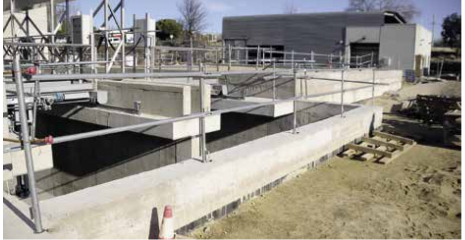
Instalaciones del Canal de Isabel II

El Canal de Isabel II sigue avanzando con las obras de mejora y modernización de sus instalaciones de bombeo y depuración de aguas residuales en Boadilla del Monte. En concreto se está actuando para facilitar las labores de explotación en la Estación de Bombeo de Aguas Residuales (EBAR) 4 frente a la acumulación de arena que traen las aguas. Esta instalación está ubicada en la calle Federico Moreno Torroba. Además de las actuaciones para mejorar el filtrado de aguas previo al bombeo, el Canal está construyendo una nave taller y un edificio de oficinas. Igualmente actuará sobre el entorno con trabajos de jardinería y ornamentación. De manera complementaria, se va a renovar también la línea de