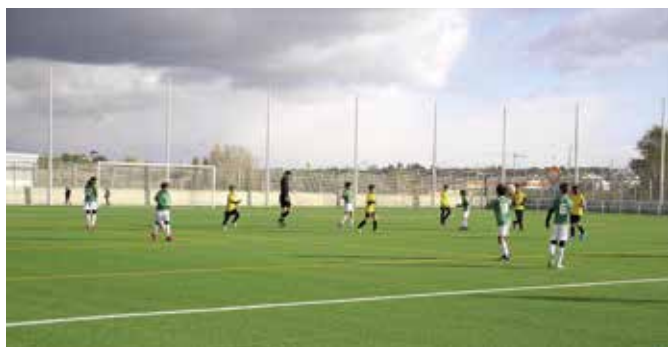
Campo de fútbol del complejo Condesa de Chinchón