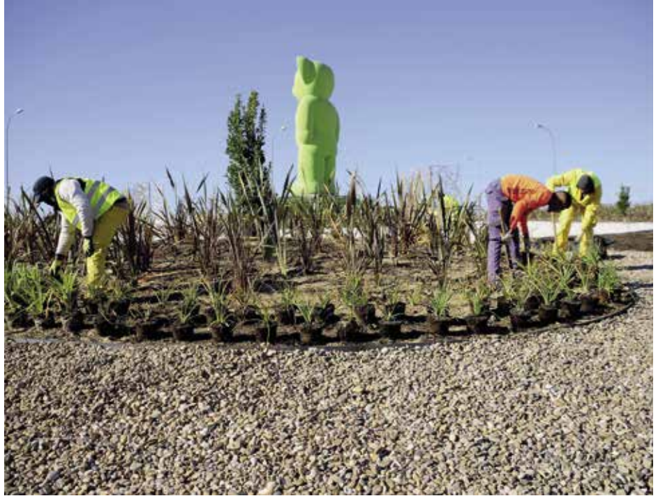
Trabajos de mejora en la rotonda de Los Fresnos

En la rotonda de Valdecabañas, por su parte, se ha realizado una nueva conexión de agua para evitar interferencias con otras redes de servicios existentes en la zona y se ha reducido significativamente la superficie de pradera , combinando la plantación de arbustivas con playas de áridos, y respetando el arbolado y las plantaciones existentes.