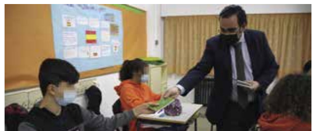
El Alcalde reparte la Constitución a los alumnos