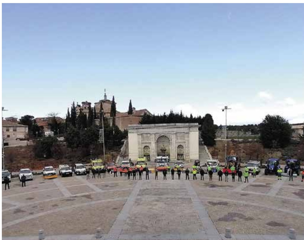
Medios disponibles en el Plan de Emergencias ante Inclemencias Invernales

Para afrontar posibles circunstancias como las provocadas por el temporal Filomena, la cantidad de sal disponible este año ha aumentado notablemente, hasta un total de 270 toneladas.