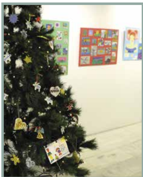
Los trabajos de los alumnos de los talleres municipales se expusieron en el Centro de Formación durante la Navidad