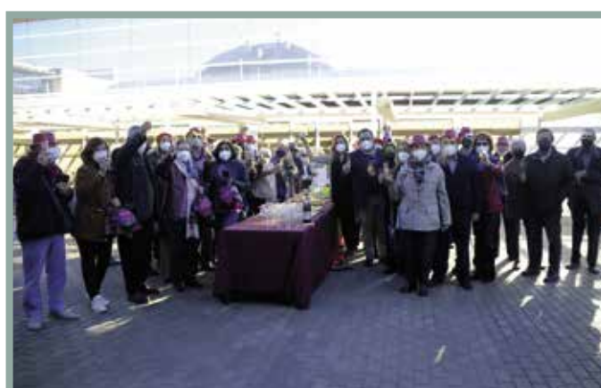
Los mayores celebraron por primera vez las pre-uvas y disfrutaron de varias tardes de cine y roscón