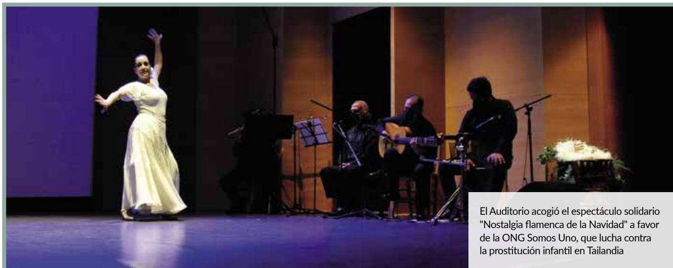
El Auditorio acogió el espectáculo solidario "Nostalgia flamenca de la Navidad" a favor de la ONG Somos Uno, que lucha contra la prostitución infantil en Tailandia