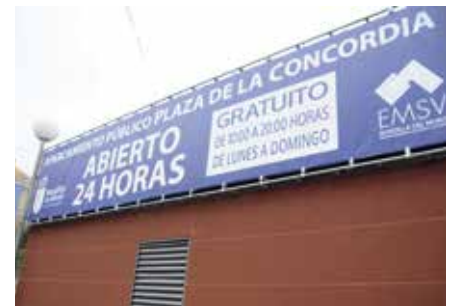
Aparcamiento plaza de la Concordia

que ha significado la gratuidad en ese amplio tramo horario.