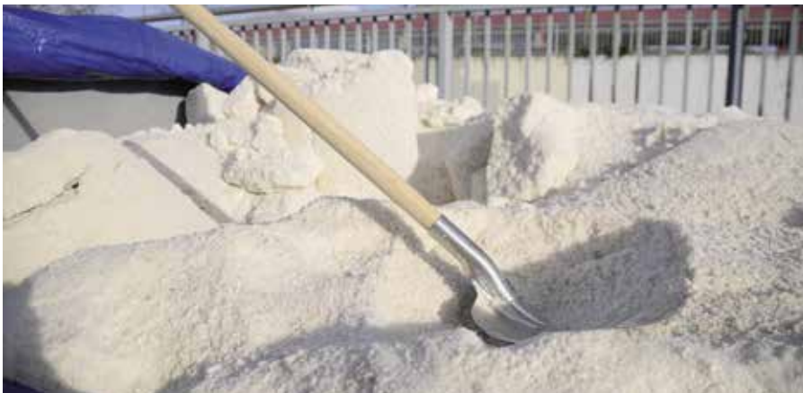
Sal distribuida entre los vecinos

Ante la llegada del invierno, el Ayuntamiento ofreció a los vecinos empadronados en la localidad 111 toneladas de sal para tenerla en sus casas y hacer frente a posibles inclemencias invernales.