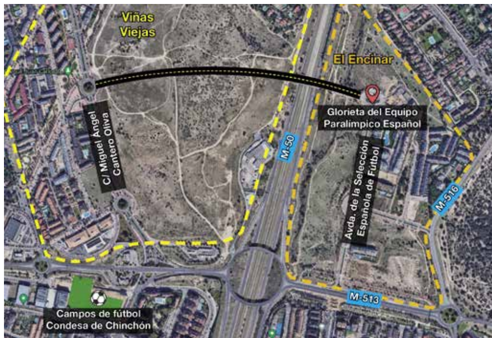
Futura conexión de Viñas Viejas con El Encinar

La conexión se realizará sobre la M-50, utilizando un puente que se construyó previendo esta actuación, entre la glorieta Equipo Paralímpico Español, en El Encinar, y la glorieta de intersección de las calles