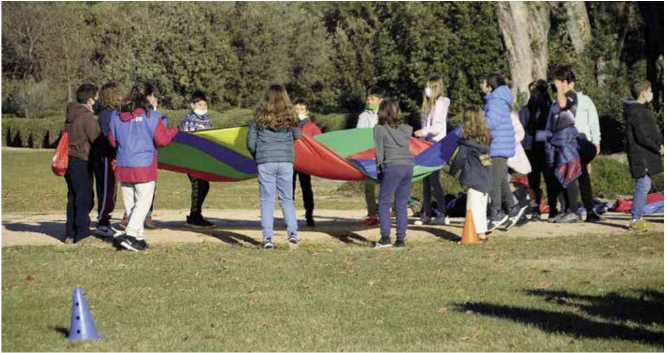
Niños realizando una prueba de la gymkana

La instalación El Bosque de la Ciudad Financiera de Banco Santander acogió una yincana de pruebas con alguno de los sentidos o capacidades mermadas