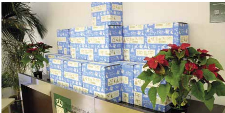
Cestas de Navidad entregadas por el Ayuntamiento

El Ayuntamiento repartió 130 cestas de Navidad a familias del municipio en situación de vulnerabilidad y que durante 2021 hubieran percibido ayudas de emergencia social, pobreza infantil y riesgo energético a través del Centro de Servicios Sociales municipal.