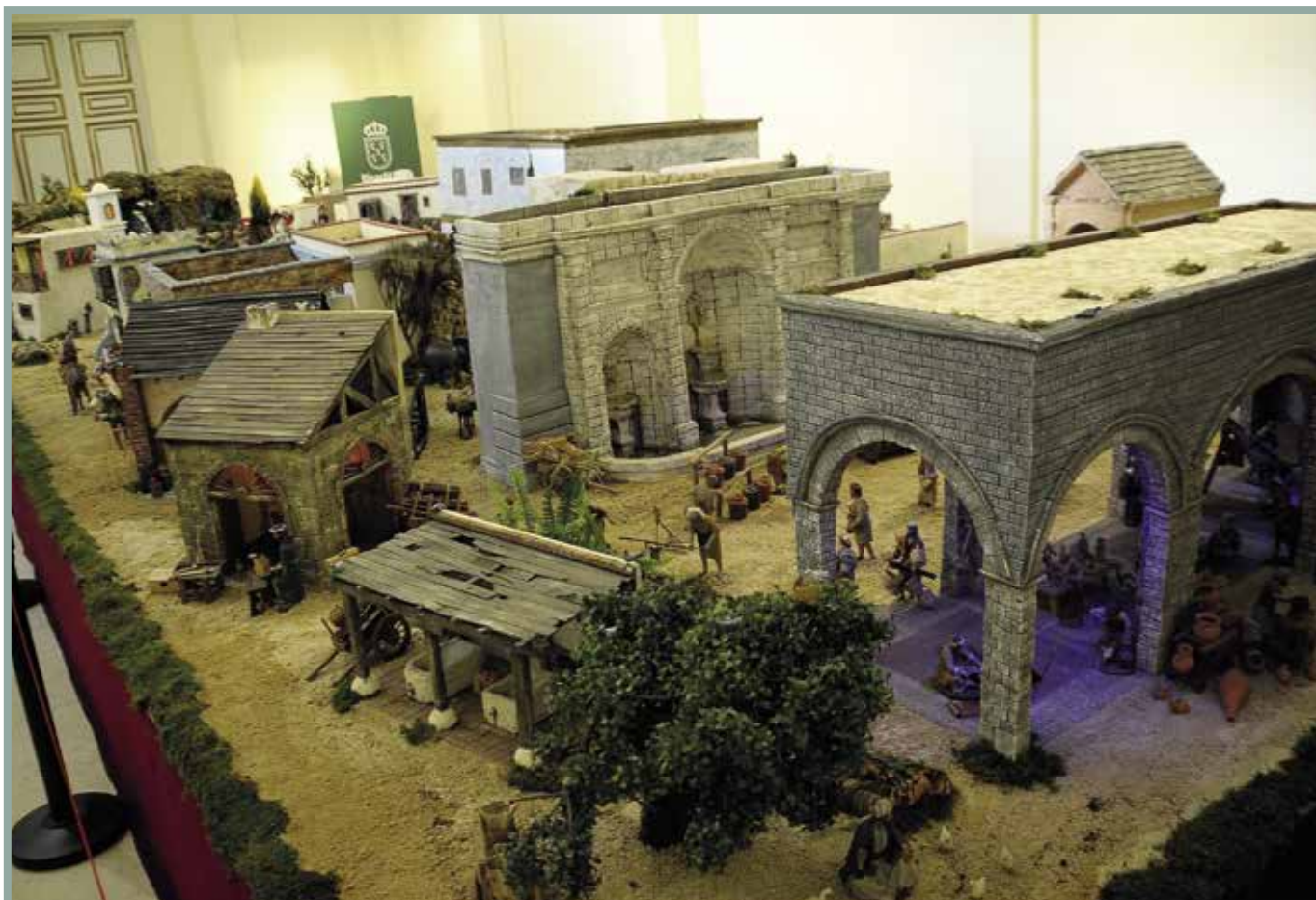
Cientos de personas visitaron el Gran Belén tradicional, de 50 metros cuadrados, instalado en el Palacio y el Misterio, que se expuso en la capilla