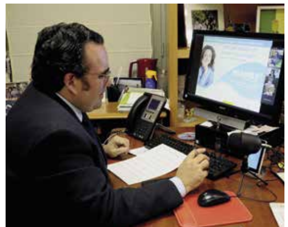
El Alcalde participa en la conferencia online

El encuentro se enmarca dentro de las actividades de la red Menores ni una gota, promovida por la Federación Española de Espirituosos, de la que el Ayuntamiento de Boadilla forma parte desde 2018.