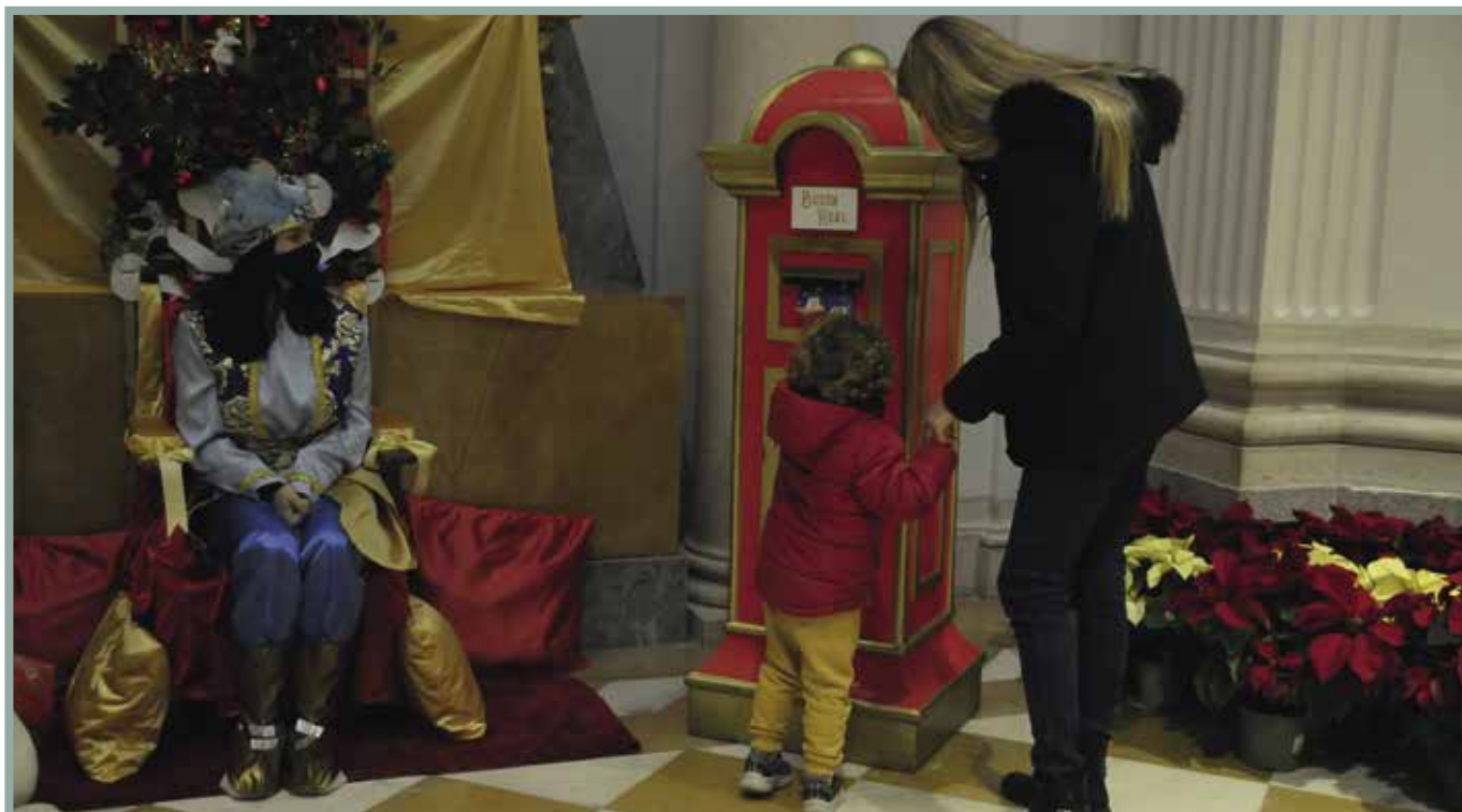
Los carteros reales recogieron las peticiones de los niños de Boadilla a Melchor, Gaspar y Baltasar