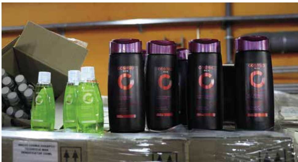
Botes de champú donados por ALCAMPO

El reparto se realizó a través de las asociaciones que apoyan a estos colectivos y los voluntarios de Protección Civil.