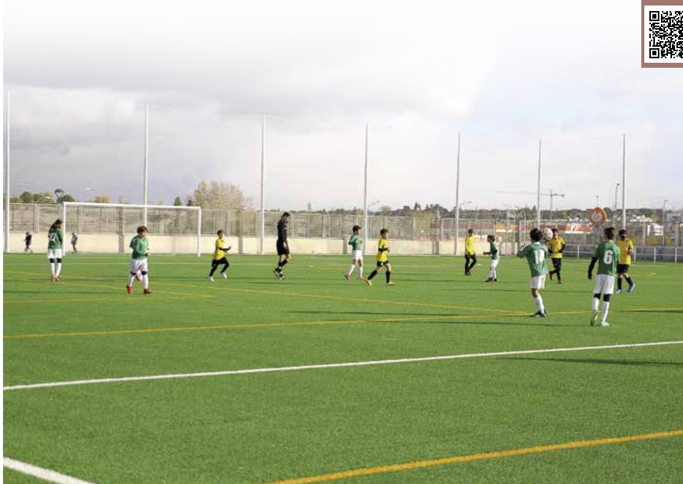
Entrenamiento en uno de los campos del complejo deportivo

El Ayuntamiento ofrece la posibilidad de alquilar los campos de fútbol del Complejo Deportivo Condesa de Chinchón, tanto a vecinos empadronados como a interesados que no lo estén.