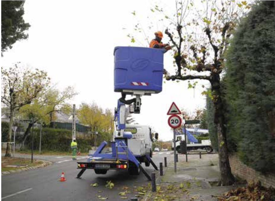
Poda de árboles en las urbanizaciones históricas

El Ayuntamiento está desarrollando, hasta el mes de marzo, la campaña anual de poda de árboles, que incluye 6860 ejemplares (pinos, plátanos, moreras, etc.). Las podas se están realizando en las urbanizaciones históricas, casco, sectores, La Cárcava y El Pastel. Para realizar los trabajos las brigadas cuentan con máquinas elevadoras y camiones para la recogida y el transporte de la leña.