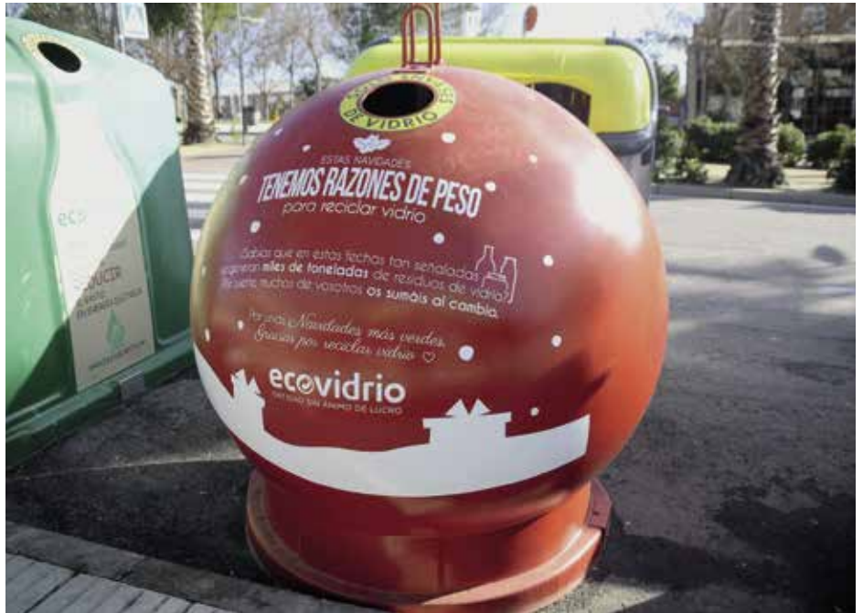
Contenedor de Ecovidrio

Con el objetivo de fomentar el reciclaje de envases de vidrio durante la época navideña, Ecovidrio, en colaboración con el Ayuntamiento, desarrolló una campaña de concienciación entre los vecinos para promover una Navidad más verde . Esta entidad sin ánimo de lucro se encarga de la gestión del reciclado de los residuos de envases de vidrio en España. Además de la colocación en varias zonas del municipio de contenedores con la imagen de la campaña, un educador ambiental informó a los viandantes sobre los beneficios del reciclaje de envases de vidrio.