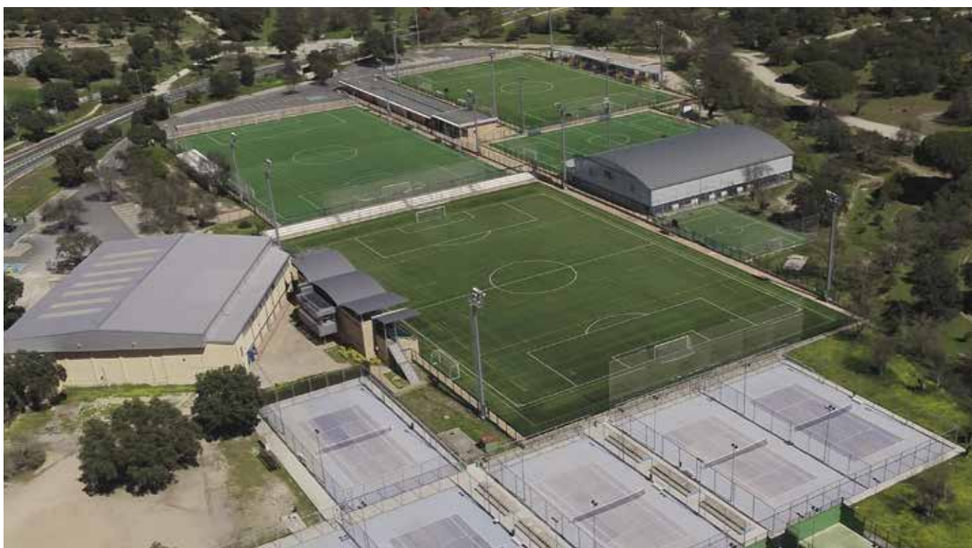
Complejo Deportivo Ángel Nieto