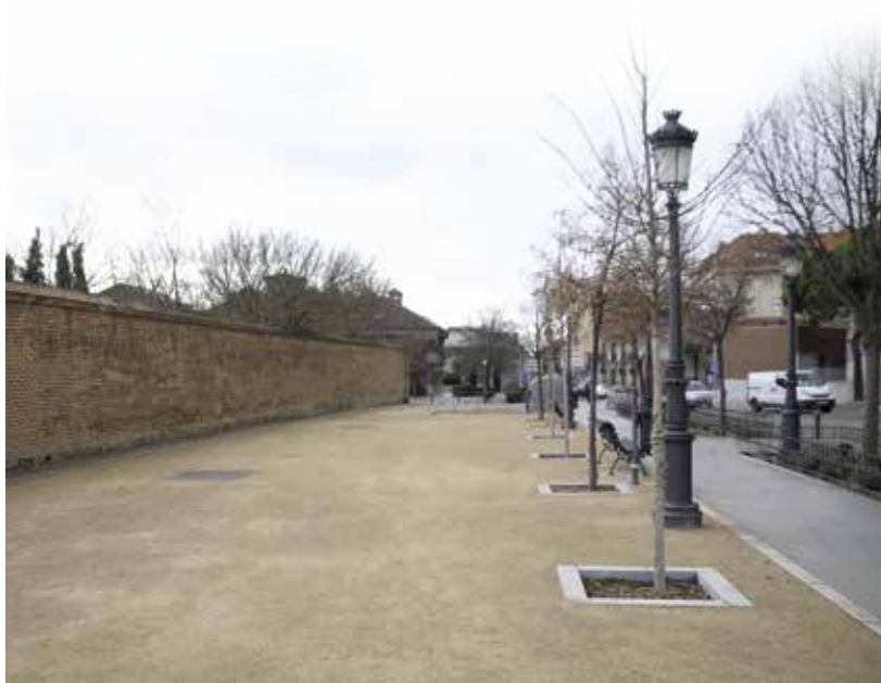
Parterres del Palacio con nuevo solado

El importe para esta actuación ha ascendido a 72.743, 35 euros más IVA.