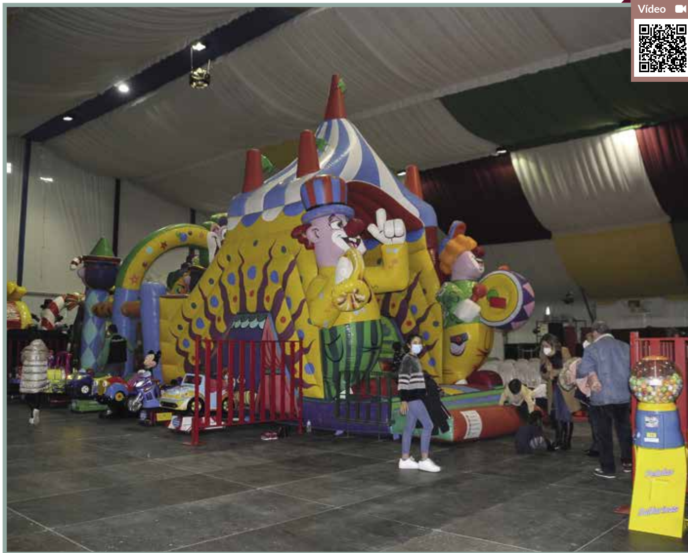
20.000 personas pasaron por la carpa de Navidad, donde hubo hinchables, juegos tradicionales, videoconsolas, atracciones y talleres de distintas temáticas