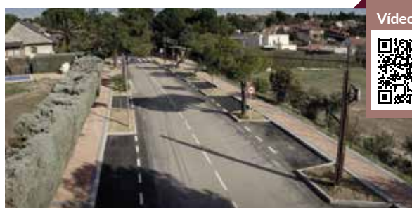
Nuevo acerado en Río Duero

Además de la pavimentación y señalización nuevas, también se ha colocado nuevo mobiliario urbano y se han renovado los parterres. Asimismo, se ha instalado una talanquera de madera de 150 metros de longitud en la confluencia de las calles Río Tajo y Río Guadiana