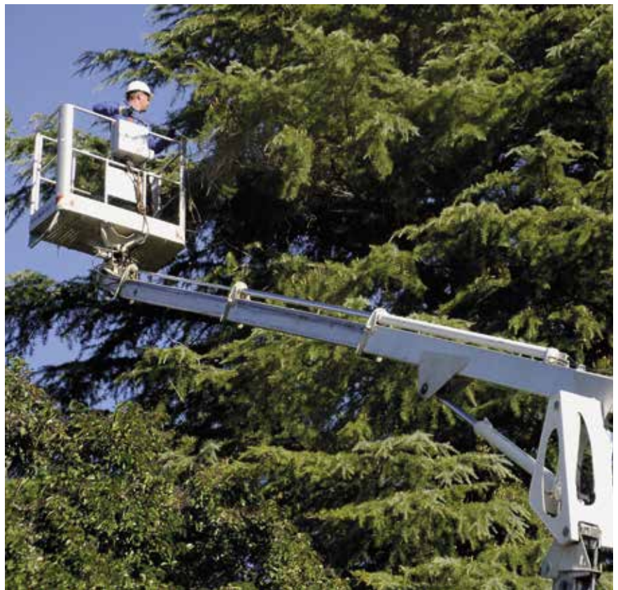
Operario retirando un nido de cotorra

Las campañas de control de cotorras, que cuentan con los pertinentes permisos de la Comunidad de Madrid , van consiguiendo año tras año reducir notablemente el número de ejemplares en el municipio.