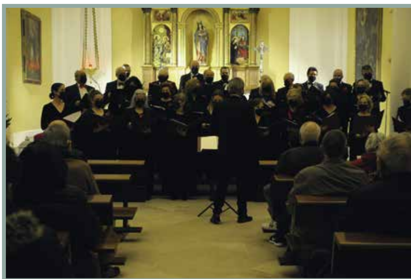
Un año más las iglesias de Boadilla acogieron conciertos interpretados por los miembros de la Escuela Municipal de Música y Danza