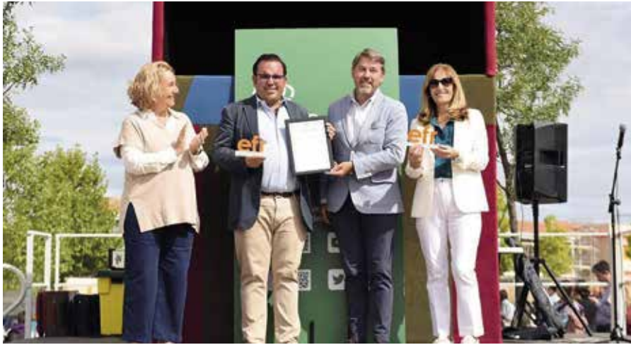
El Alcalde recoge la distinción como municipio familiarmente responsable

El Ayuntamiento de Boadilla del Monte se ha convertido en el primero de España en ser distinguido con la Certificación EFR (Empresa Familiarmente Responsable), que reconoce el