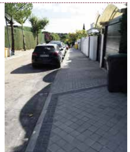
Calle Isla de Coelleira

Se ha actuado sobre una superficie de 450 m 2 . La obra ha contado con un presupuesto de 24.600 euros .