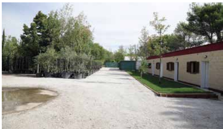
Las renovadas instalaciones del Vivero Municipal sirven de cantón para el servicio de mantenimiento y conservación de jardines