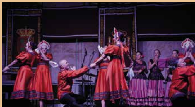
Ballet Ara en la plaza de la Cruz