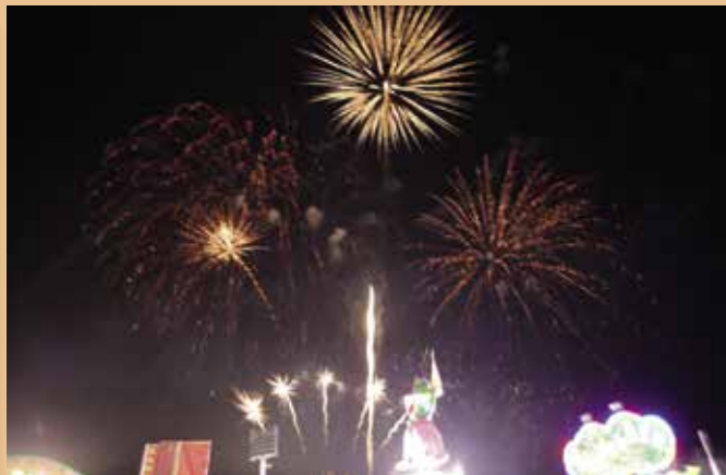
Fuegos artificiales de inicio de fiestas