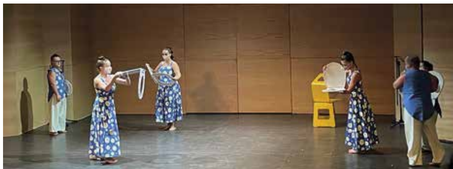
Actuación de teatro del grupo de diversidad funcional

Las actividades se extenderán hasta el próximo 30 de junio y la matriculación se puede realizar en cualquier momento del año si hay disponibilidad de plazas en la actividad elegida. La oferta contempla, en distintos grupos y horarios, actividades como teatro y artes escénicas, multideporte y atletismo, baile, cocina, expresión artística (pintura, escultura y