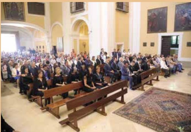
Misa en honor a la patrona