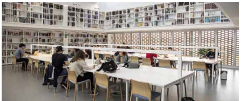
Sala de la biblioteca Princesa Doña Leonor

Entre los audiovisuales, de los 512 préstamos realizados, 316 han sido para niños y 196 de adultos.