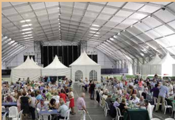
Día del Mayor