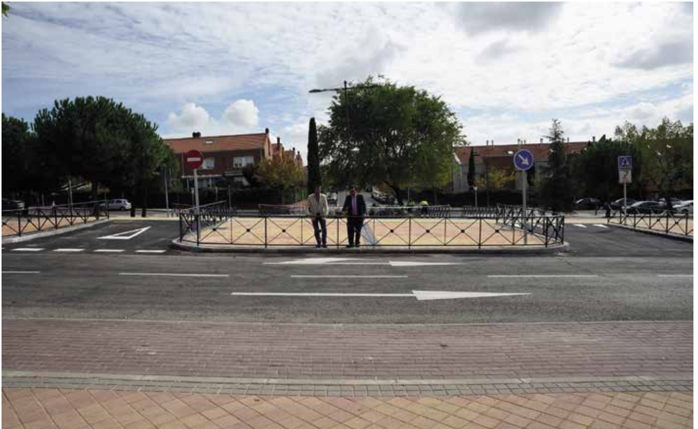
Conexión Condesa de Chinchón-Echegaray