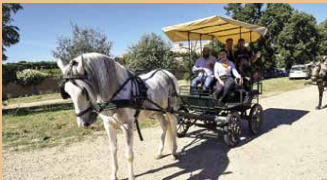
Día del Caballo