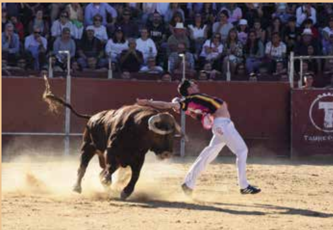
Concurso de recortes