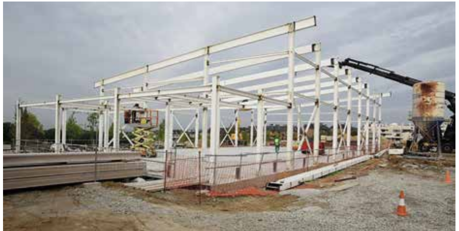
Obras de construcción del gimnasio

contará con 12 unidades de ESO y cuatro de Bachillerato, con capacidad para 500 estudiantes.