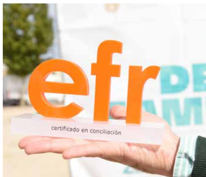
Galardón por ser municipio familiarmente responsable