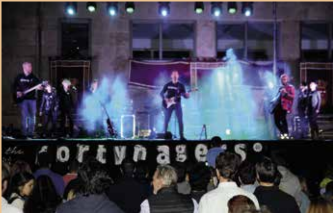
Actuación en la plaza de la Cruz