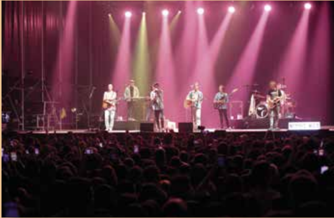
Actuación de Taburete