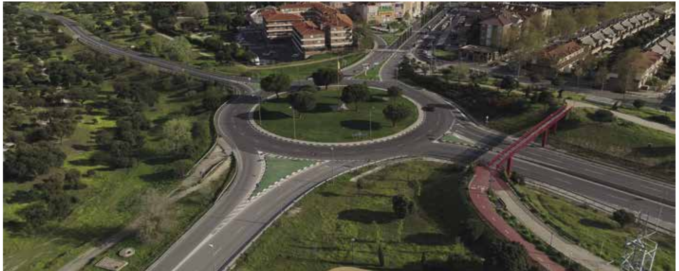
PRINCIPALES EJES DEL PLAN

El PMMU se ha elaborado teniendo en cuenta la opinión de los vecinos, de los que se han recibido más de 2200 propuestas y preocupaciones.