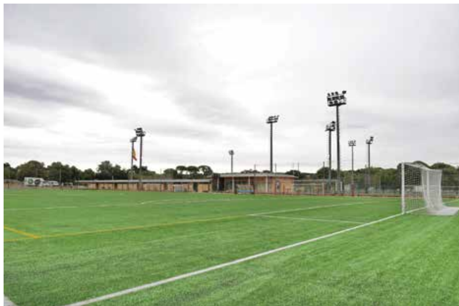
Campo de fútbol del CDM Ángel Nieto

La actuación ha contado con un presupuesto de 249.399,75 euros.