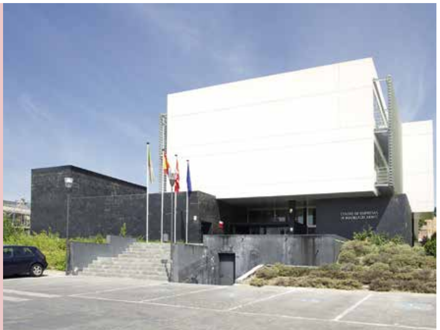
Centro de Empresas Municipal

El asesoramiento se realizará en el Centro de Empresas mediante sesiones de 45 a 60 minutos de duración. Cada interesado podrá solicitar un máximo de dos (el consultor valorará si es necesario realizar la segunda).