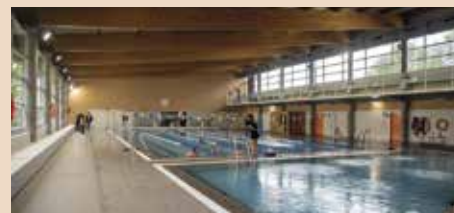
Playas reformadas en la piscina cubierta

Toda la información se encuentra disponible en la web www.piscinaboadilla.com .