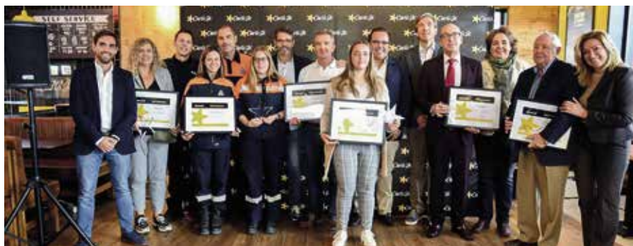
Premiados con la Estrella de Boadilla