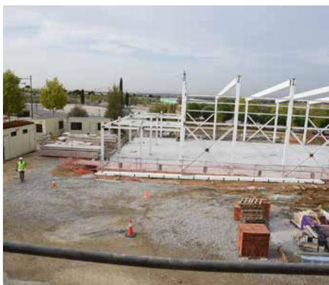
Construcción de gimnasio en el IES Isabel La Católica