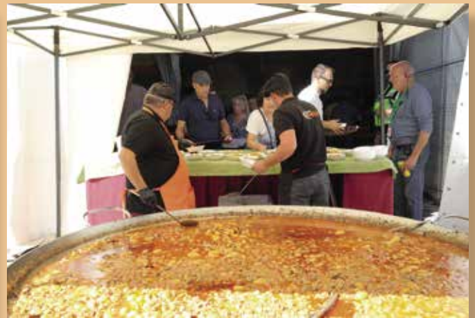
Gran caldereta popular