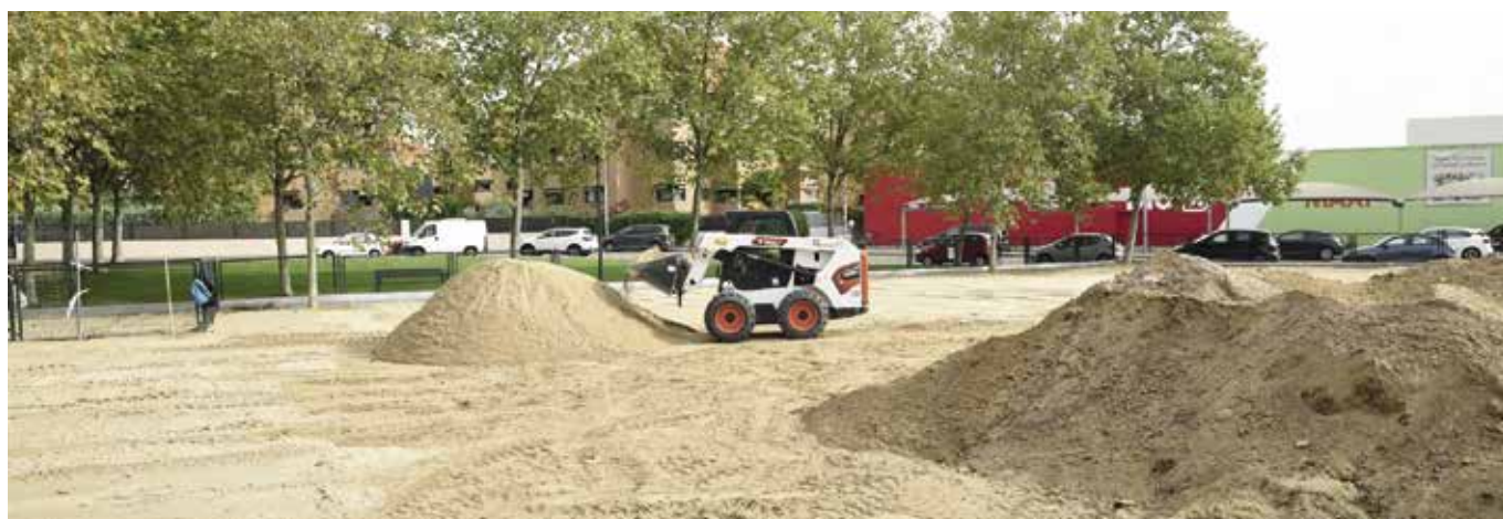
Renovación de arenero en el parque Jorge Manrique

14.000 m 2 , para aumentar el confort y la limpieza de estos espacios.