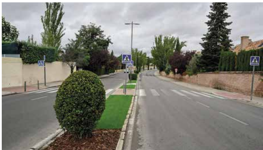
Avenida de Valdepastores

municipio. Se estima que, una vez que finalicen las mejoras en todas las zonas del municipio, se ahorrarán casi dos millones de litros de agua al año.