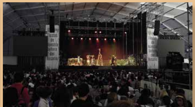
Representación de El rey León