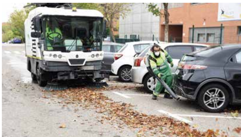
Recogida extraordinaria de hojas en otoño