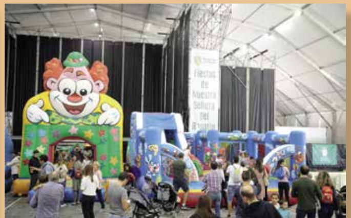
Actividades infantiles en la Carpa