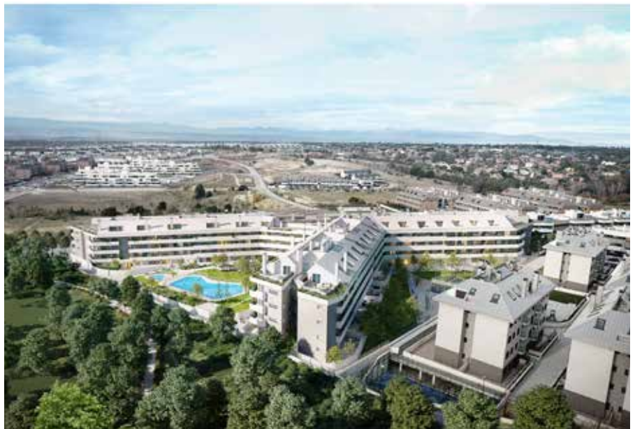
Aspecto de las futuras viviendas en Valenoso

La adjudicación se realizó en junio de 2021, por sorteo ante notario, entre las 3012 solicitudes que fueron aceptadas, al cumplir los requisitos de la convocatoria.