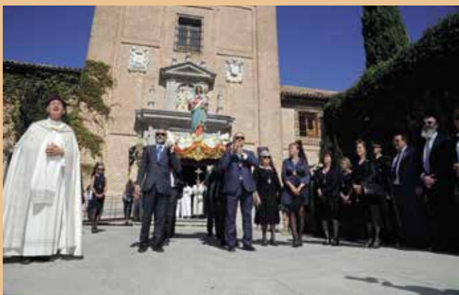
Procesión de la Virgen del Rosario