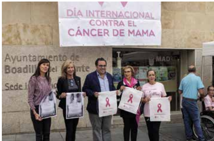
Boadilla se sumó a la celebración del Día Mundial contra el Cáncer de Mama