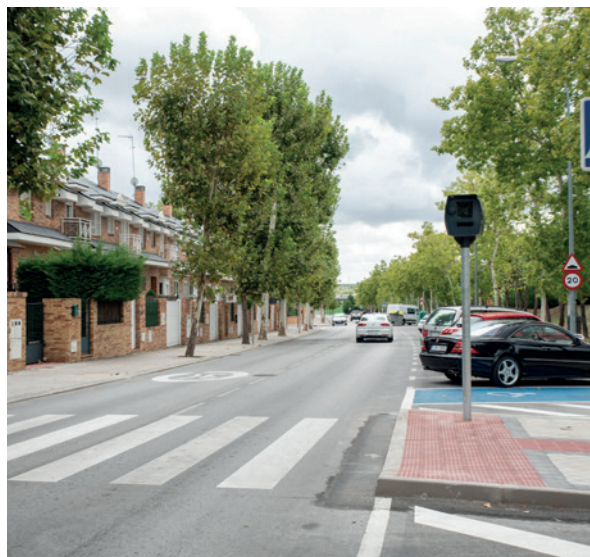
Radar móvil en Manuel de Falla

Uno de los radares se coloca de manera alternativa en las casetas instaladas en las avenidas Infante D. Luis, Miguel Ángel Cantero Oliva y Montepíncipe . Los dos radares móviles , por su parte, se pueden instalar en las cabinas de Manuel de Falla y Playa de Formentor , y también de forma aleatoria en cualquier zona del municipio . Este radar se emplea especialmente en los puntos donde habitualmente se superan los límites de velocidad establecidos.