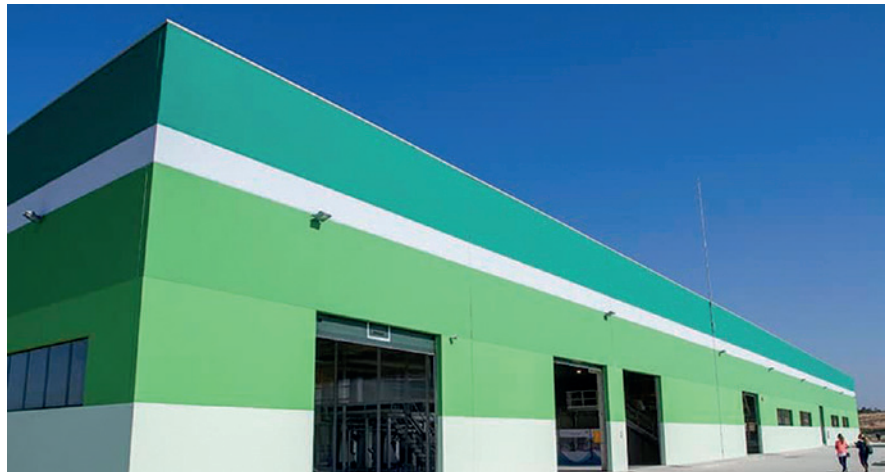
Depuradora de Valenoso

El Canal de Isabel II ha incluido a Boadilla en su plan de instalación de placas solares en depuradoras de la Comunidad de Madrid. Junto con ella, las instalará también en las plantas que se encuentran en Madrid, Getafe, Colmenar de Oreja y Arganda del Rey.