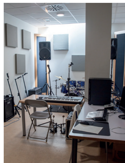
Local de ensayo