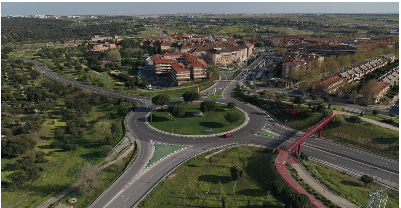
Vista aérea de Boadilla

El universo es personas mayores de 16 años empadronadas en Boadilla, con cuotas de sexo, edad y zona de residencia. El margen de error es del 3,5 %.