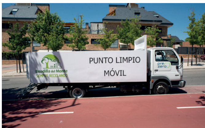
Punto Limpio Móvil

Los vecinos pueden llevar residuos como radiografías, fluorescentes, pilas, aerosoles, aceite vegetal, aparatos eléctricos y electrónicos, ropa usada, pinturas y fluorescentes.