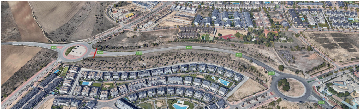
Vista aérea de la zona en la que irá la pasarela

La redacción del proyecto de instalación de una cuarta pasarela, peatonal y ciclista, sobre la M-513 está en licitación; esta conectará la zona de Olivar 3ª fase (Valenoso) con El Pastel.