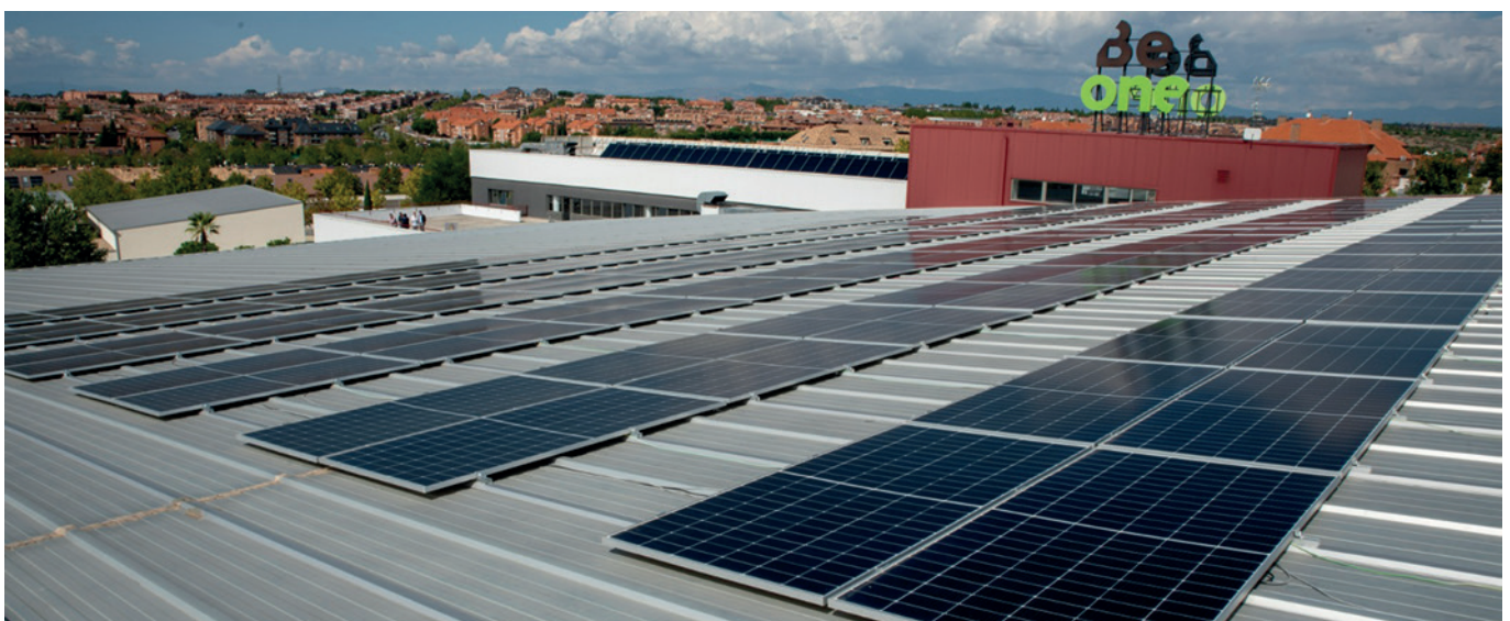
Paneles solares en el BeOne

potencia total de 118,8 kWp, que podrán generar 166.639 kWh anualmente y evitarán la emisión a la atmósfera de 655,3 toneladas de CO 2 .