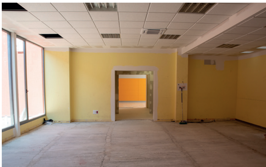
Nueva aula de la Escuela de Danza

El pasado año se matricularon 300 alumnos en danza y 80