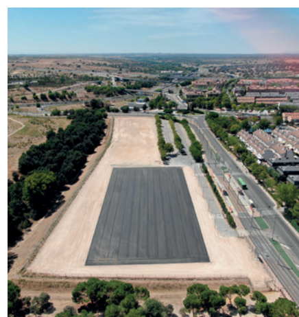
Vista aérea del Recinto Ferial

Por otra parte, estas obras mejorarán la accesibilidad a las personas con movilidad reducida y aumentarán la higiene y limpieza de los eventos que el Ayuntamiento organice.