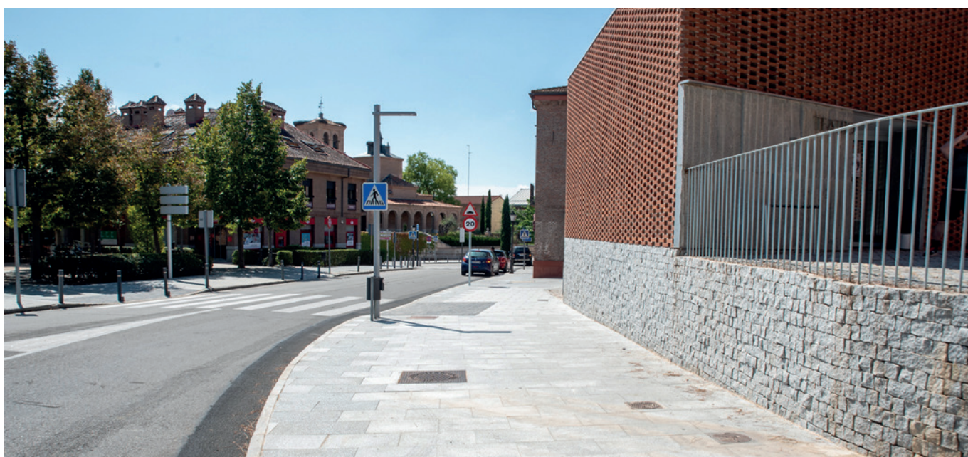
Acera ampliada en la avda. Adolfo Suárez

La obra ha contado con un presupuesto de 10.820 euros.