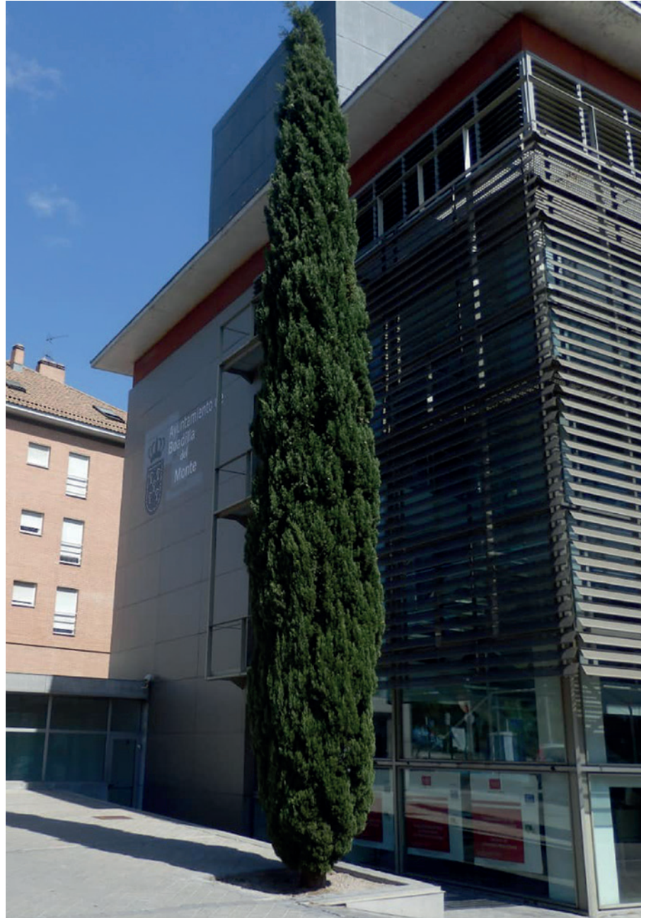
Sede administrativa del Ayuntamiento

En lo relativo a los importes, destacan los contratos re-