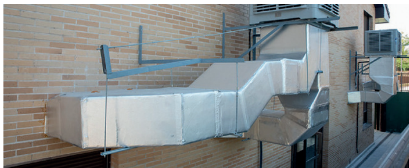
Equipos de bioclimatización

El importe de esta actuación ha ascendido a 290.413,41 euros , de los que 120.000 han sido subvencionados por la Consejería de Medio Ambiente, Vivienda y Agricultura de la Comunidad de Madrid, dentro del plan PIMA Cambio Climático.