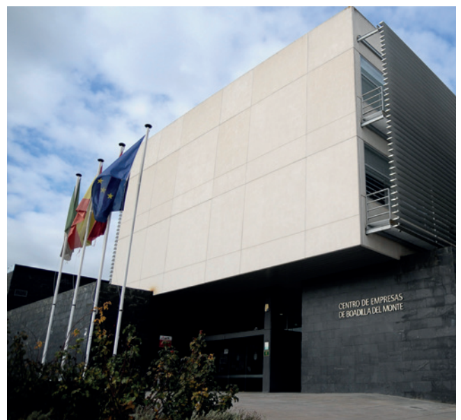
Centro de Empresas Municipal

El Ayuntamiento ha conseguido ahorrar en el consumo eléctrico de los edificios municipales un 20,32 % en el primer semestre de 2023, en comparación con el consumo que se produjo en el mismo semestre del año anterior. En concreto, se ha pasado de 1.557.526 kWh a 1.221.113 kWh; comparando solo el consumo del mes de junio en ambos años, el ahorro sube al 37,38 %. Entre las medidas aplicadas por el Consistorio para ahorrar en el alumbrado público destacan la instalación de placas fotovoltaicas en varios edificios municipales; el cambio de luminarias públicas y de lámparas municipales a tecnología LED; la telegestión de todos los cuadros de mando; la revisión de potencias en muchos puntos y la modificación de tarifas en algunos de ellos.