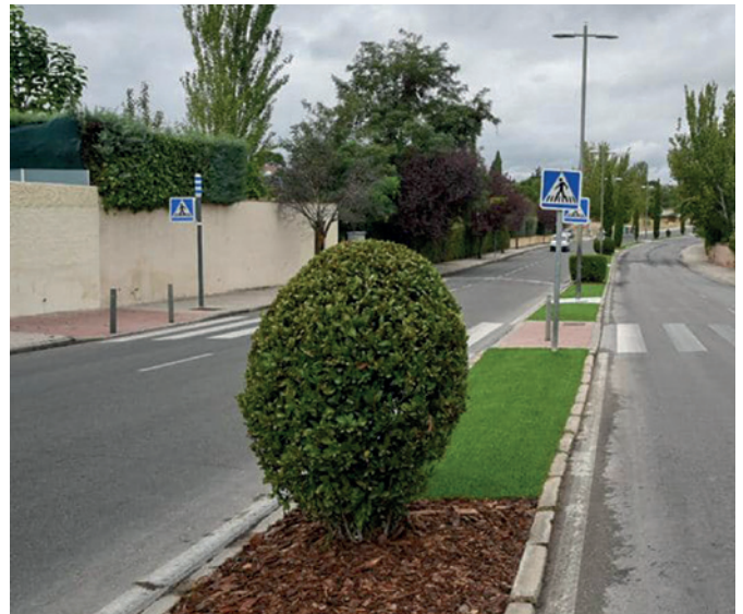
Mediana en la avenida de Valdepastores