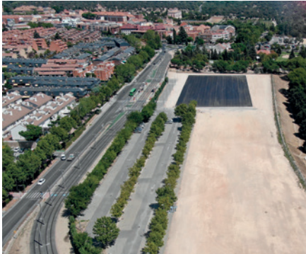
Obras del centro de transformación

Con el fin de suministrar energía eléctrica a todos los eventos y ferias que se realizan en el Recinto Ferial y zona anexa (paseo Madrid y carretera de Villaviciosa), el Ayuntamiento está construyendo un centro de transformación, con dos trafos de 800 kVA y la línea de media tensión que lo alimenta.