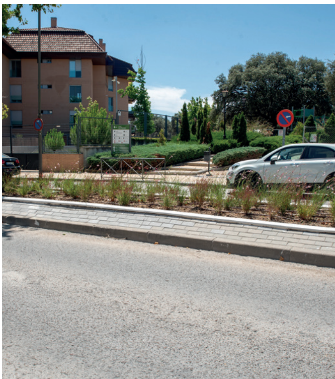
Jardineras en Junta de Castilla y León

En las jardineras, con una superficie total de unos 170 m 2 , se han plantado 700 ejemplares de gaura , una especie que crea macizos compactos y cerrados.