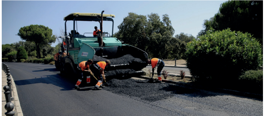
Actuación de asfaltado en Boadilla

El Ayuntamiento de Boadilla está licitando el asfaltado de 28.856 metros cuadrados de superficie, repartidos en el casco, Sector S, Las Lomas, Parque Boadilla y Olivar de Mirabal. Esta actuación, cuyo importe de licitación asciende a 586.759,65 euros, cuenta con un 66 % de financiación a cargo del Plan de Inversiones Regionales de la Comunidad de Madrid.