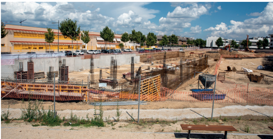
Inicio de obras de las 158 viviendas

La promoción contará también con zonas comunes, zona infantil, piscina y pista de pádel. El precio total de las viviendas, incluyendo trastero y dos plazas de garaje, oscila entre 172.840,86 euros y 261.099,59 euros, IVA incluido.