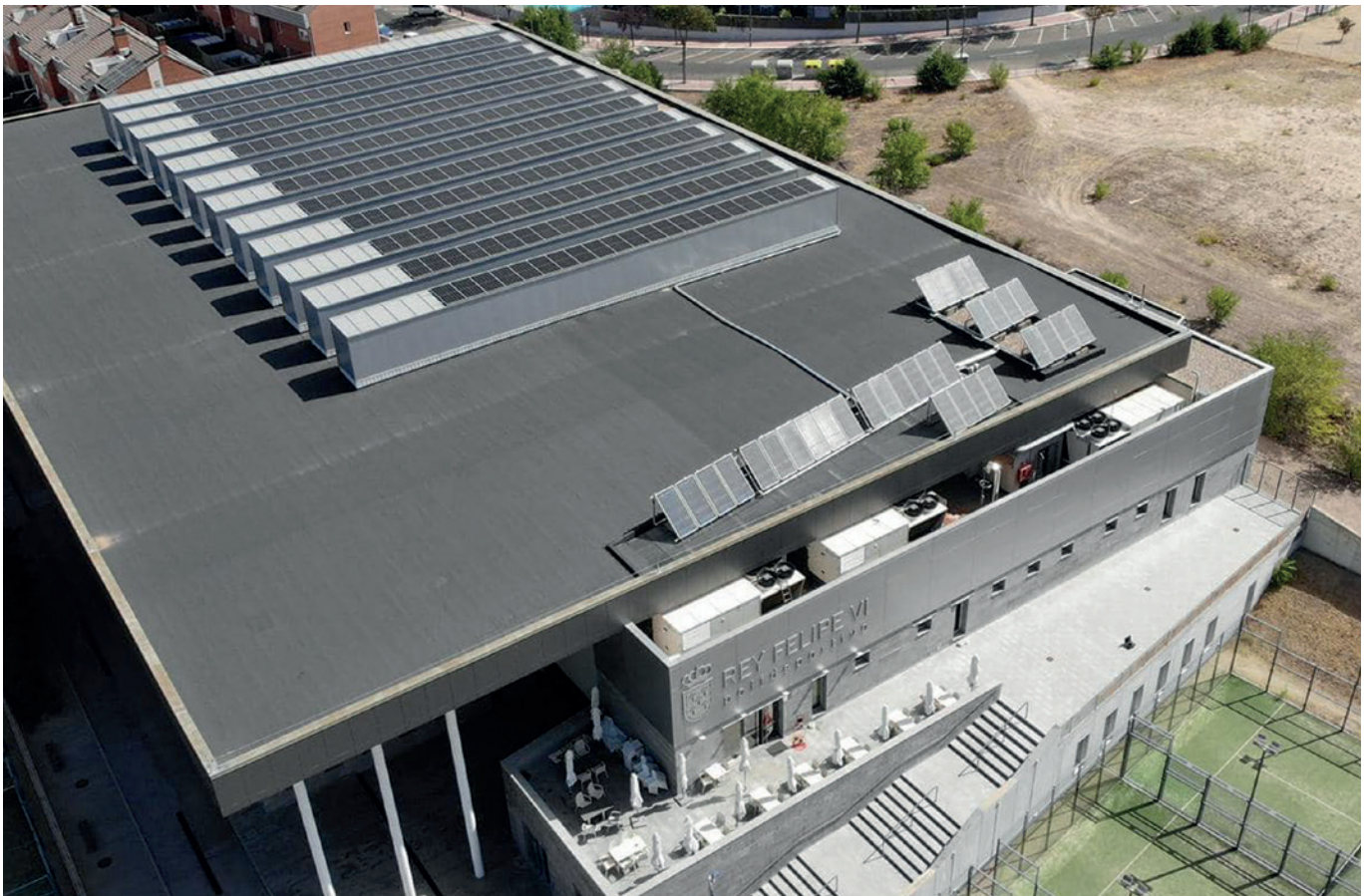
Placas fotovoltaicas en el pabellón Rey Felipe VI

-Sede adtva. del Ayuntamiento y Centro de Mayores María de Vera (60 kWn, 70.000 euros).