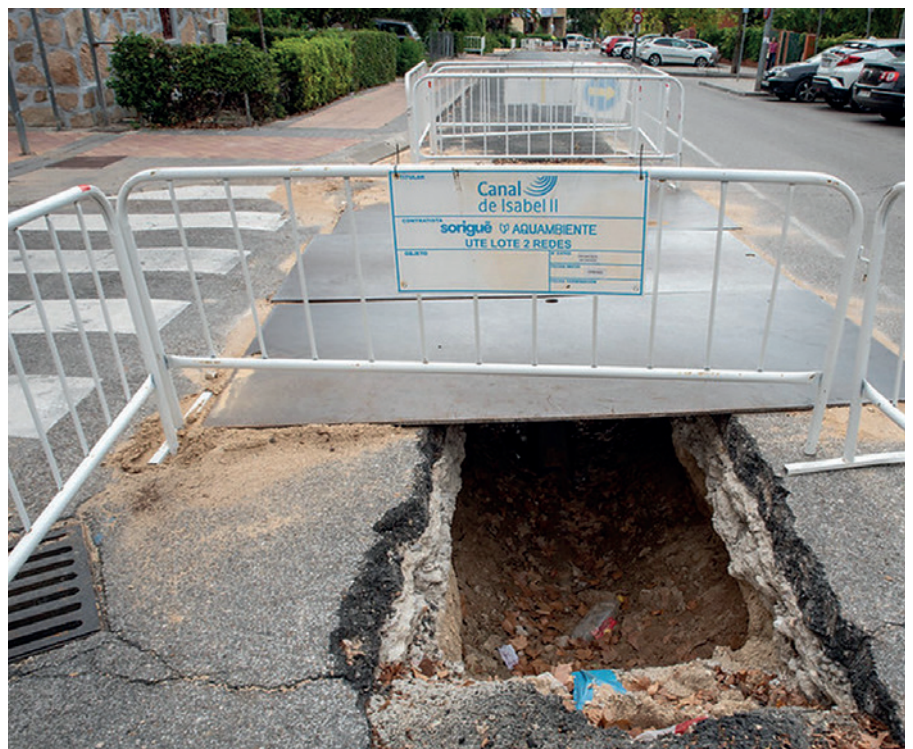
Obras de renovación de la red de abastecimiento

La actuación, que se ejecutará a lo largo de los próximos meses en tres fases, cuenta con una inversión de casi tres millones de euros e incluirá la demolición de pavimentos y excavación de zanjas, instalación de las tuberías y otros elementos necesarios, colocación de arquetas de suelo y armarios de contadores, y reposición de los pavimentos.