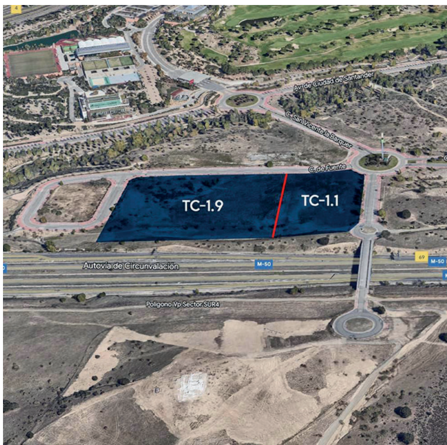
Vista aérea de las parcelas que se subastan

La enajenación de las parcelas se está haciendo mediante concurso y procedimiento abierto.