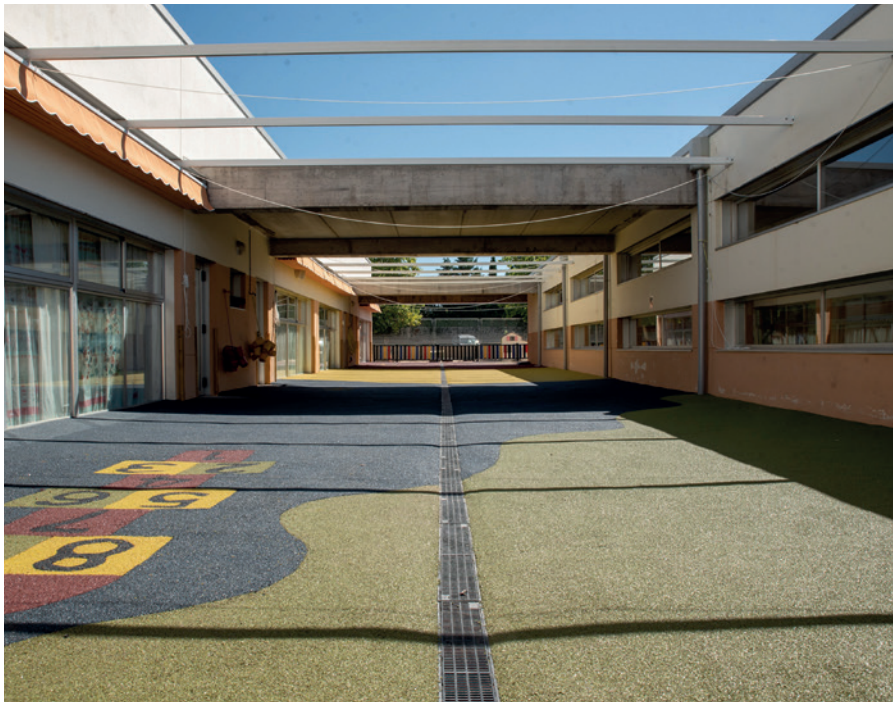
Zona infantil en el CEIP Federico García Lorca

El Ayuntamiento ha mejorado durante estos meses de verano las áreas infantiles de varios centros educativos con actuaciones como: sustitución de caucho, con la instalación de casi 1500 m 2 , modificación de cerramientos metálicos existentes, nuevos cerramientos de valla electrosoldada, reconstrucción de zonas de areneros, formación de aceras para separación de zonas de caucho y areneros e instalación de valla de colores.