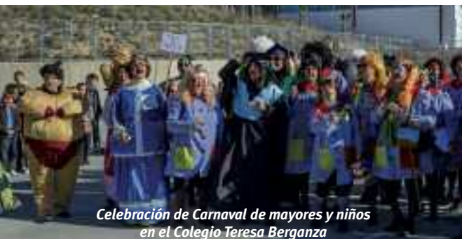
Celebración de Carnaval de mayores y niños en el Colegio Teresa Berganza

La empresa Boadilla Audio S.L. participó de forma voluntaria poniendo un coche tuneado con música, acompañando a los participantes en la cabecera del pasacalle.