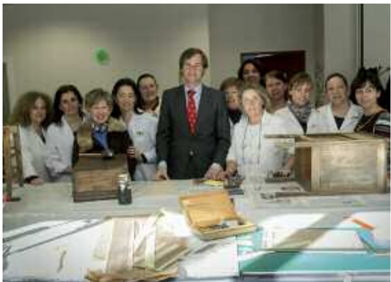
El Alcalde con las alumnas de restauración

Por su parte, las alumnas del taller de restauración deben aportar piezas antiguas para recuperar y aprenden a valorar el estado de la obra, a decidir cuál es la intervención más adecuada para el mueble en cuestión y llevarla a cabo, siempre bajo la dirección de su profesora.