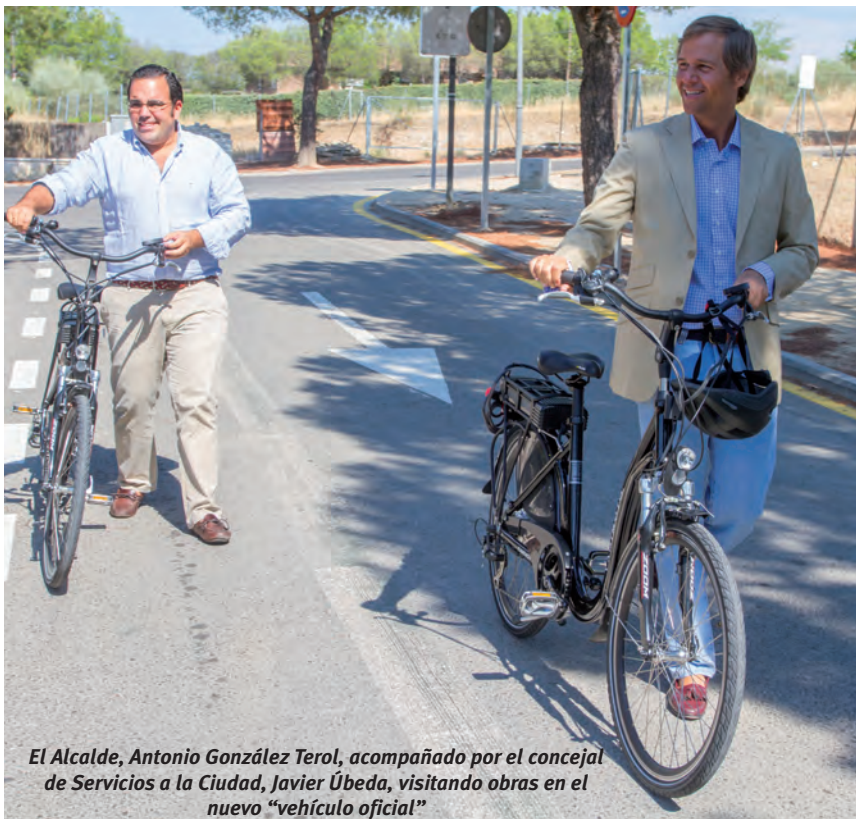
El Alcalde, Antonio González Terol, acompañado por el concejal de Servicios a la Ciudad, Javier Úbeda, visitando obras en el nuevo “vehículo oficial”

El pasado mes de junio, González Terol ya renunció al coche oficial, cediéndolo a la Policía Municipal, y utilizando para desplazamientos más largos un coche de incidencias del Ayuntamiento.