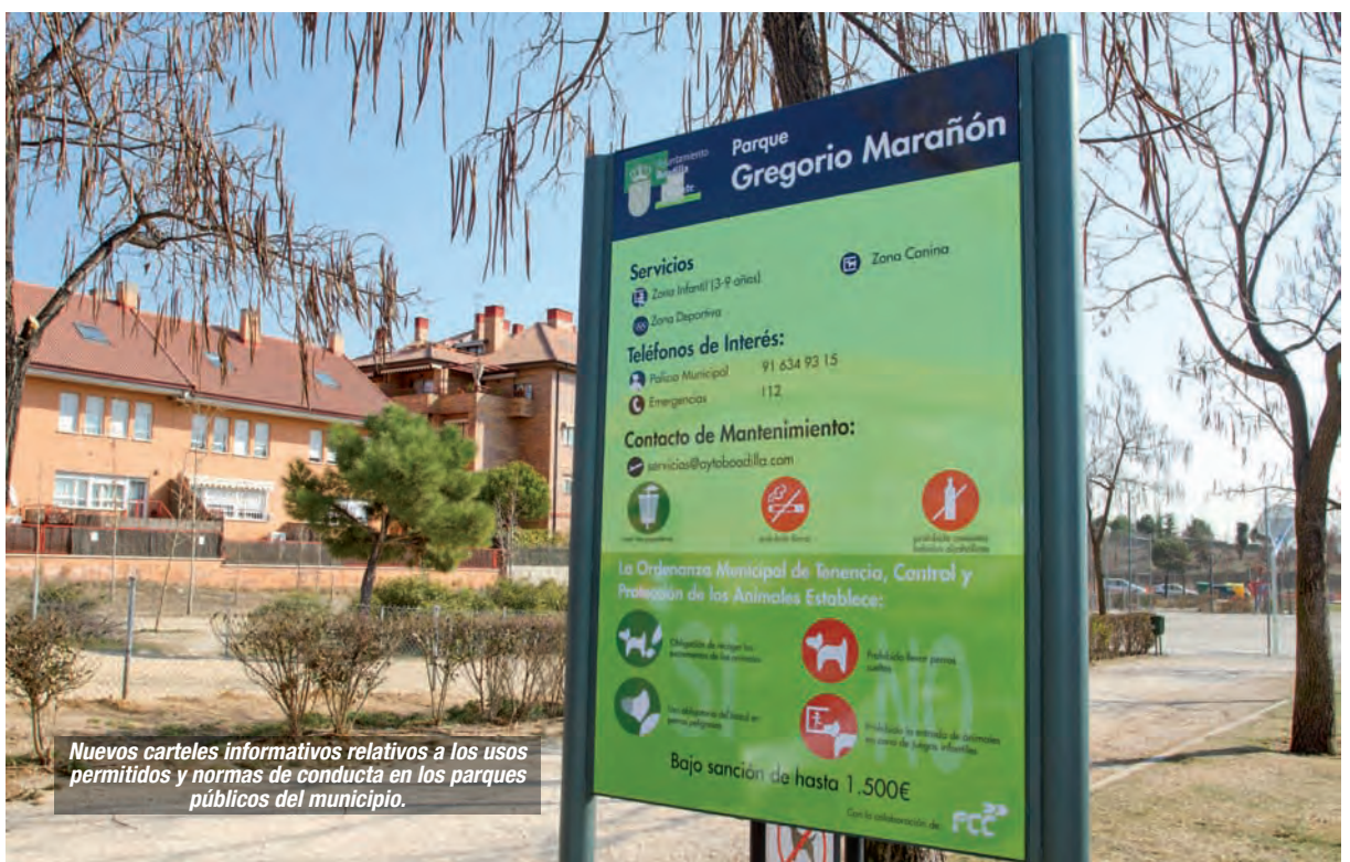
Nuevos carteles informativos relativos a los usos permitidos y normas de conducta en los parques públicos del municipio.

Para completar esta actuación se eliminarán los “puntos negros” de acumulación de suciedad como alcorques o corridos carentes de arbolado y se realizará una campaña informativa sobre buenas prácticas entre los comerciantes de la localidad.