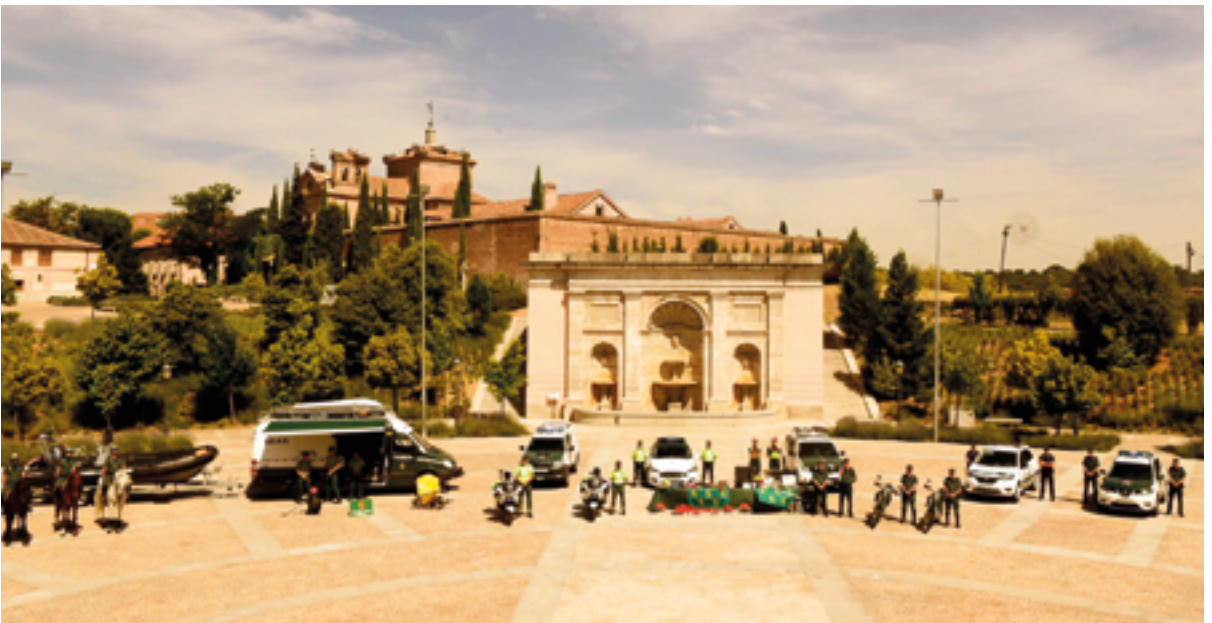
El alcalde felicita a cinco agentes de la Policía Local por sus recientes ascensos

dad de Madrid, con la limpieza del monte, especialmente los 38 kilómetros de cortafuegos, y el mantenimiento de las fajas de seguridad. A las labores que realiza el retén forestal regional, integrado de forma permanente por 12 personas, se añaden los cinco efectivos que suma como refuerzo en época estival el Ayuntamiento.