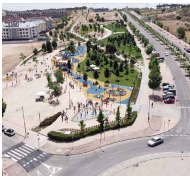
Parque Miguel Ángel Blanco