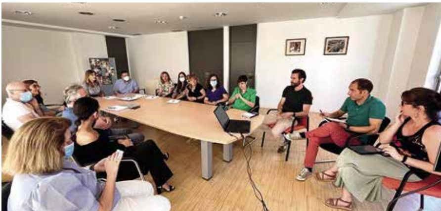
Reunión de la Mesa Técnica sobre Diversidad Funcional

Las conclusiones del estudio permitirán elaborar las respuestas adecuadas para mejorar la calidad de vida del colectivo de personas con discapacidad.