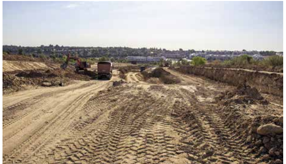
Obras de conexión de Viñas Viejas y El encinar

El presupuesto de la obra asciende a 2.354.660 euros, IVA incluido, y el plazo de ejecución es de seis meses.