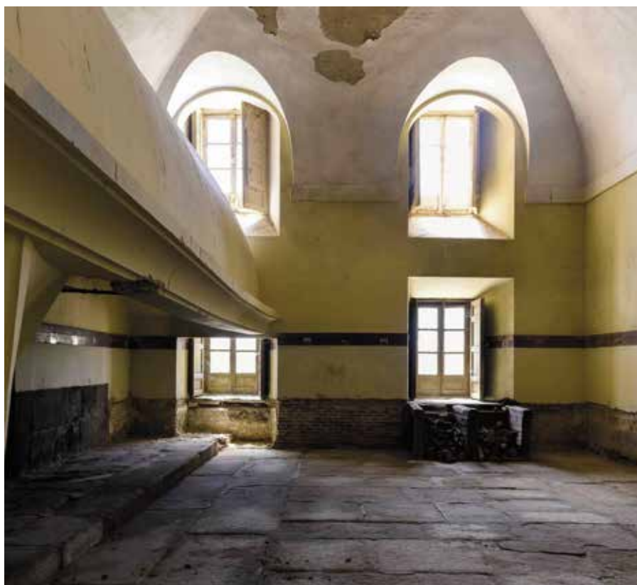
Cocina del Palacio

técnicos municipales, tras analizar los muros de la cocina, de que, al menos el lateral del Palacio del Infante D. Luis, fue fruto de una ampliación del palacio original del siglo XVII.