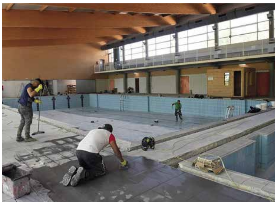
Trabajos de reforma en la piscina cubierta

La actuación, que cuenta con un presupuesto de 119.042,83 € (IVA incluido) , pretende recuperar el ornato y calidad de los acabados.