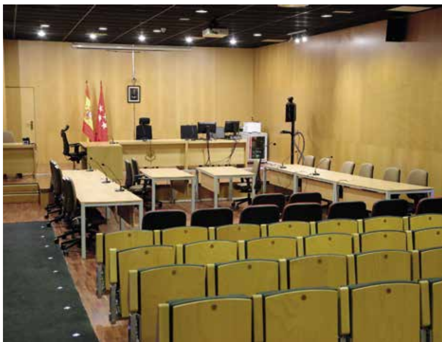
Sala de juicios en Boadilla

La defensa de los intereses económicos del Ayuntamiento y de la