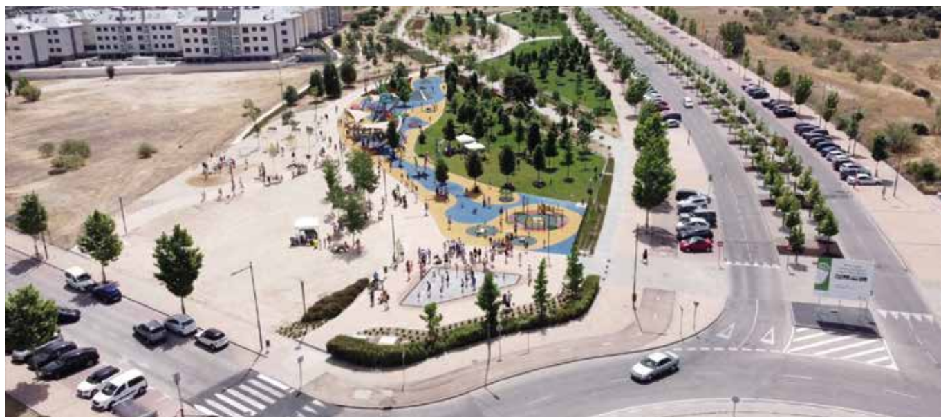
Parque Miguel Ángel Blanco

dad de este durante el tiempo de vigencia de la concesión. El criterio único de adjudicación será el precio, estableciéndose el canon tipo de licitación (al alza) en 34.024 euros anuales.