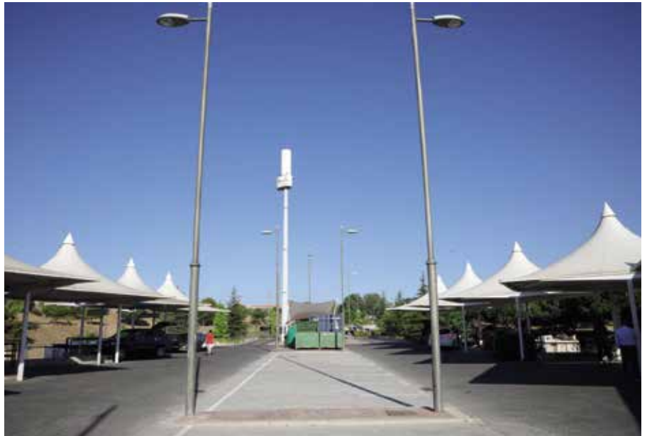
Nuevas plazas de aparcamiento

Esta actuación ha contado con un presupuesto de 39.995 euros, más IVA.