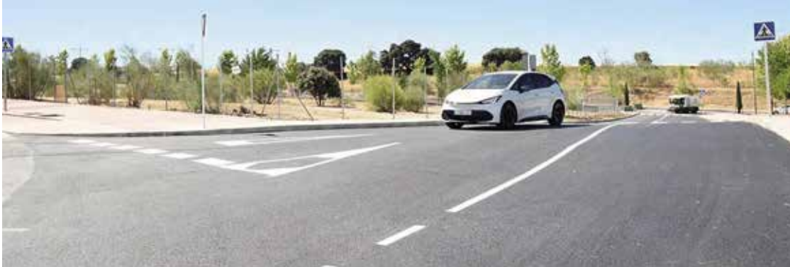
Vía de conexión entre ambas calles