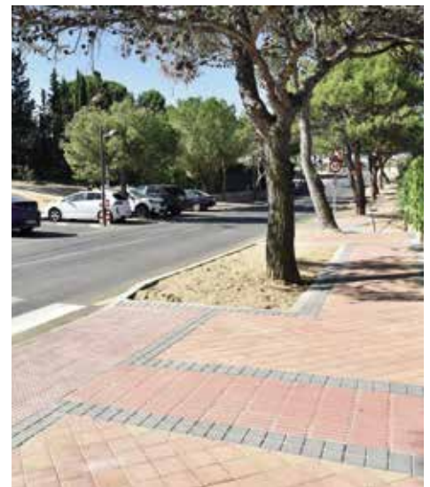
Acerado en Parque Boadilla

Estas obras se suman a otras que se han ejecutado a lo largo de la legislatura también en otras urbanizaciones, como Bonanza u Olivar de Mirabal, concretamente en las calles Playa Riazor, Monte Almenara y Monte Puig Campana.