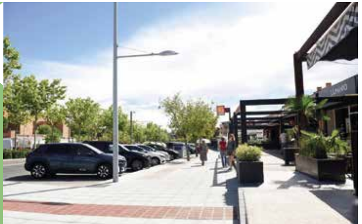
Nuevo acceso desde la avenida Condesa de Chinchón a la calle Echegaray