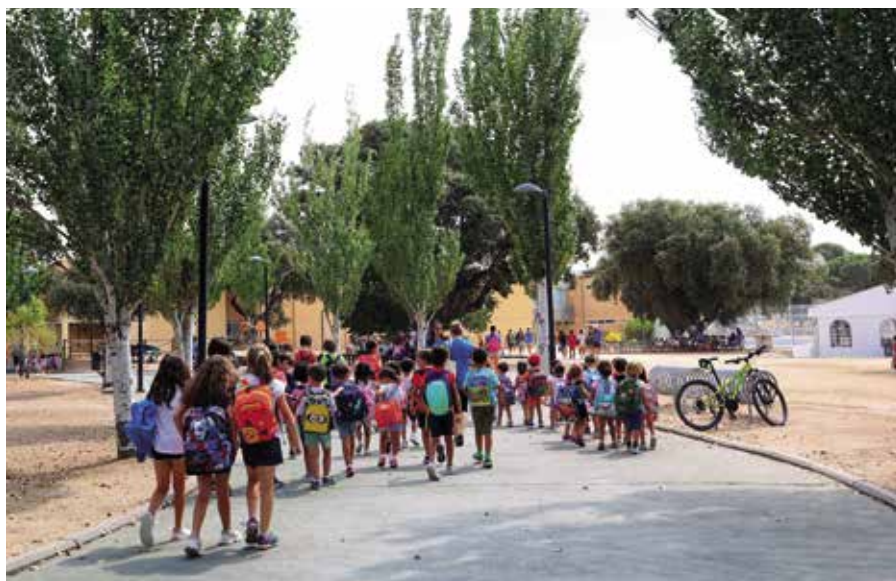
Colonias de verano

Este año también se ha desarrollado un campamento urbano en