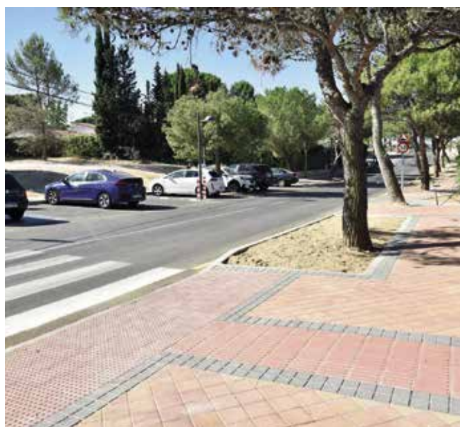
Acerado en Parque Boadilla