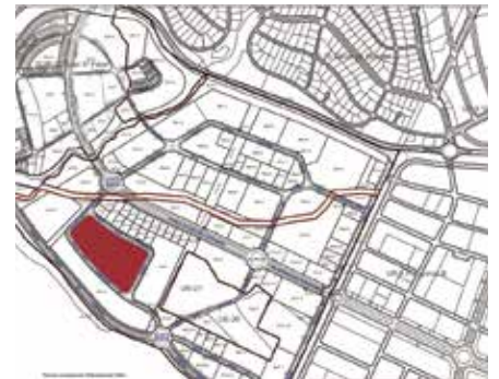
Plano de ubicación para las viviendas del Plan Vive

centro de trabajo o, llegado el caso, sin mínimo de antigüedad en la Comunidad de Madrid.