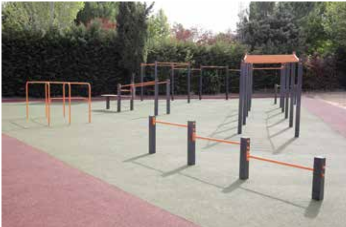
Nueva zona de calistenia junto al área deportiva de la calle Cabo de Peñas, en El Pastel