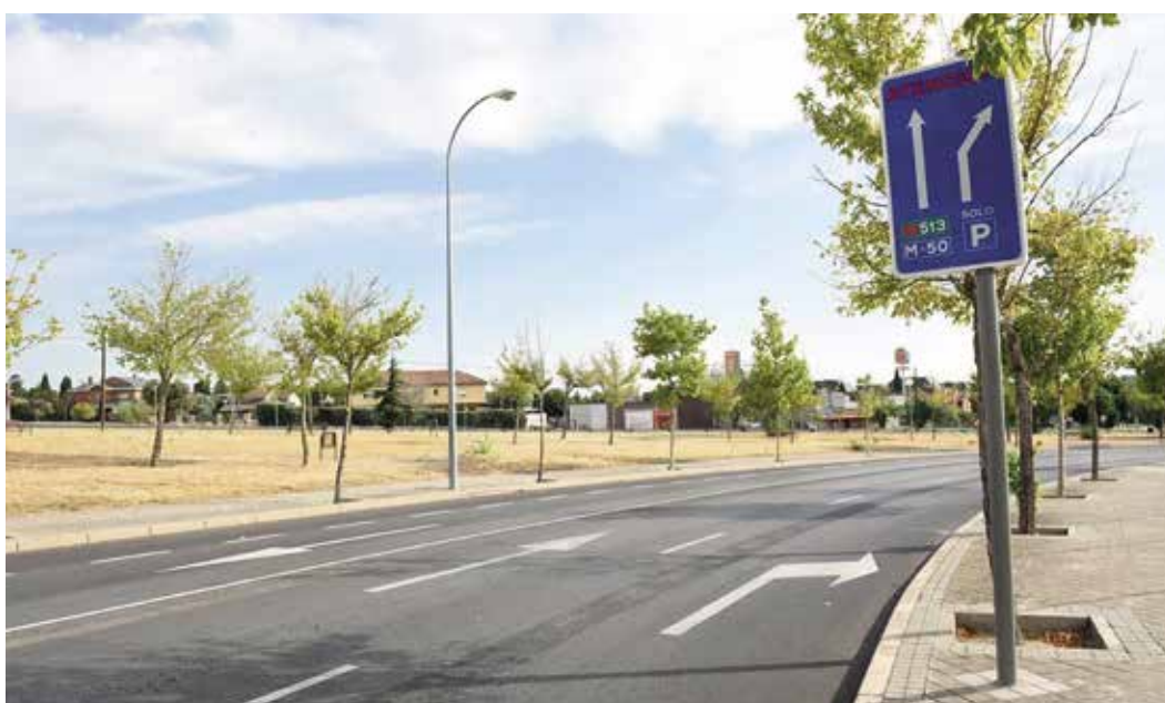
Acceso al aparcamiento del polideportivo

El presupuesto para esta actuación ha ascendido a 7100 euros.