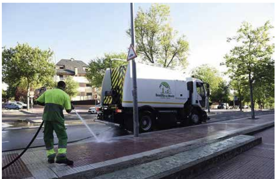
Limpieza especial con chorro a presión

Siglo XXI e Infante don Luis y algunas calles de Viñas Viejas y Los Fresnos.