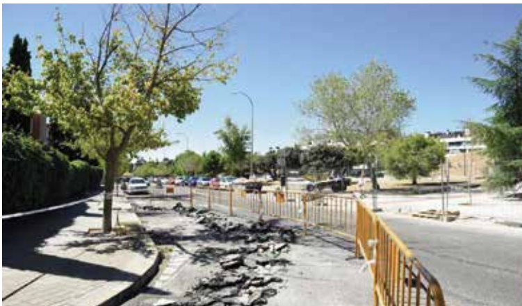
Obras de acerado y construcción de un aparcamiento ecológico en Isla Coelleira (Valdepastores)